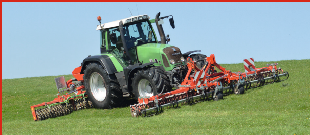
GÜTTLER® GreenMaster 600 Alpin