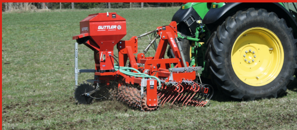
GÜTTLER® GreenMaster 3 m