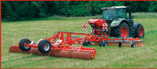
GÜTTLER® GreenSeeder 600 / 750 + Mayor ou Master 640 / 770