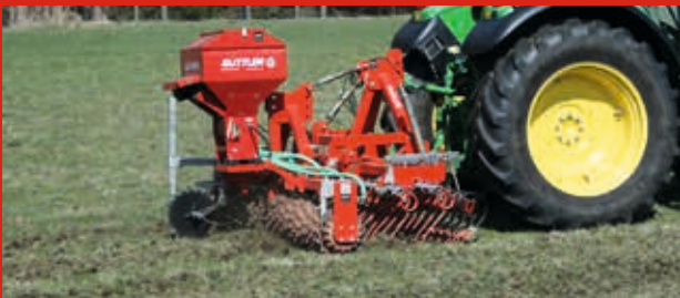
GÜTTLER® GreenMaster 3 m