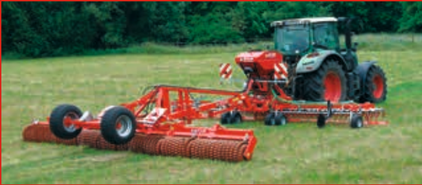
GÜTTLER® GreenSeeder 600 / 750 + Mayor ou Master 640 / 770