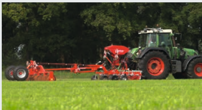
Nivelier, herser, semer et rouler en une seule opération.