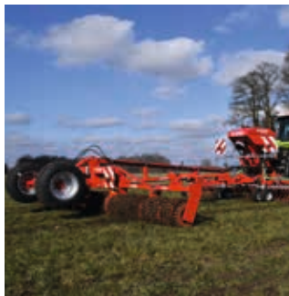
... ou combinable avec le rouleau Mayor

L'humidité du sol si précieuse est préservée