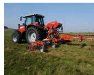
Semoir pneumatique Il distribue les semences avec précisions au plus près du sol.