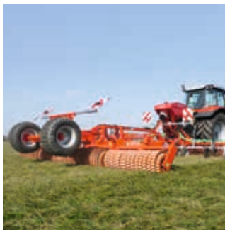
Au choix avec un rouleau trainé Master ...

La famille GreenSeeder peut être combinée à tout moment avec un rouleau trainé GÜTTLER®