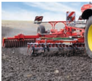
Implantation de cultures dérobées