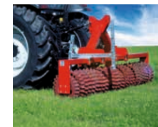
... assure le tallage des herbes pour une augmentation des rendements de fourrage !