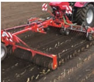
Lutte contre la pyrale du maïs avec semis simultané d'une culture d'hiver

L'humidité du sol si précieuse est préservée