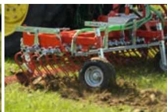
Même en conditions difficiles, les dents de 12mm travaillent efficacement.