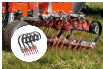
La plus courte herse à 4 rangées du marché ! Le Ripperboard double le nombre de dents, on passe ainsi de 2 à 4 rangées!