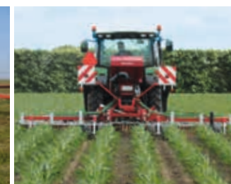
Semis sous couvert, désherbage. Une des nombreuses utilisations du GreenSeeder !