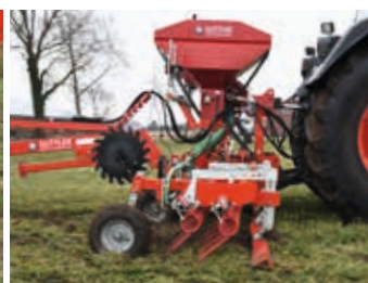
... ou la barre niveleuse