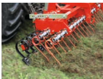
En option, le Ripperboard ...

1 La herse à quatre barres la plus courte du marché (avec ripperboard)