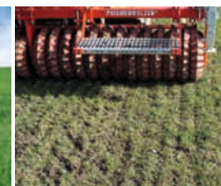
... lors du sursemis, le rouleau plombe les semences pour une germination optimale.