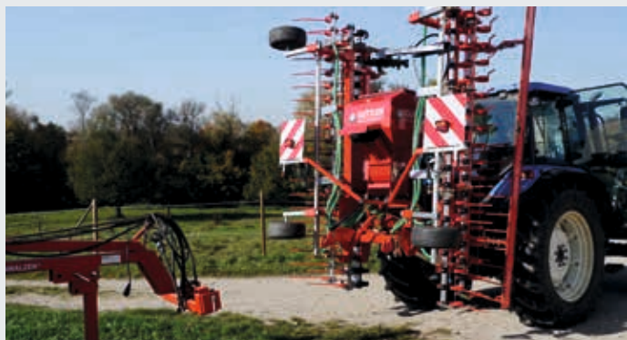
Le rouleau est équipé d'un couplage rapide.