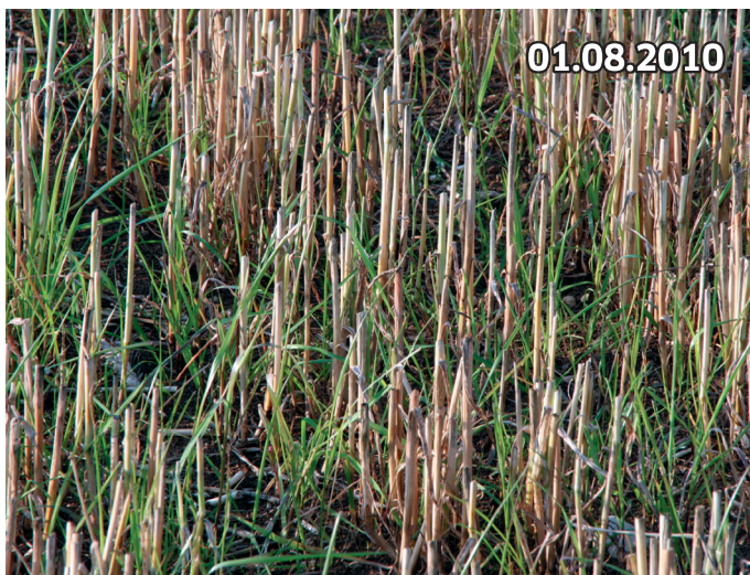
Nach der Ernte bekommt die Untersaat Luft und Licht und entwickelt sich prächtig. Einfacher und günstiger können Sie Bio-Masse nicht erzeugen!