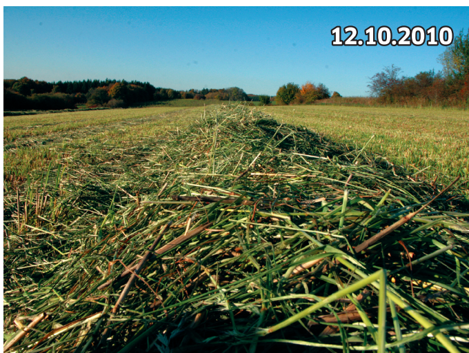
Standort: Schwäbische Alb, ca. 700 Meter ü.N.N.