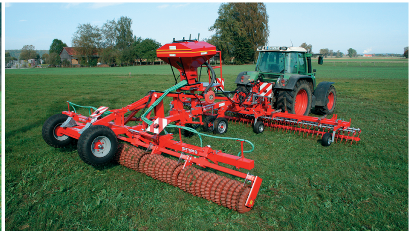
GreenMaster 770 = Master 770 + Sägerät + Grünlandstriegel