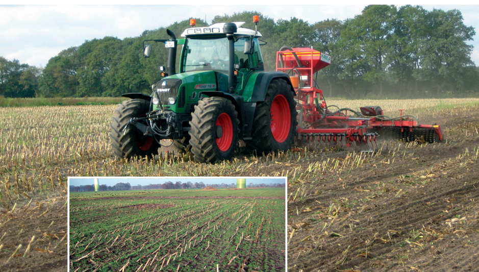
... im Frühjahr