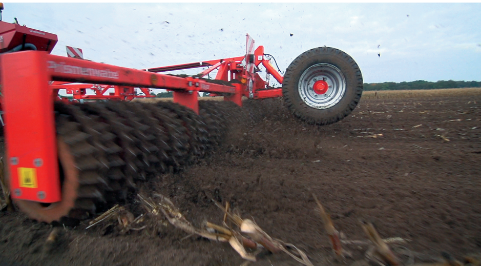
Exzellente Boden Anpassung