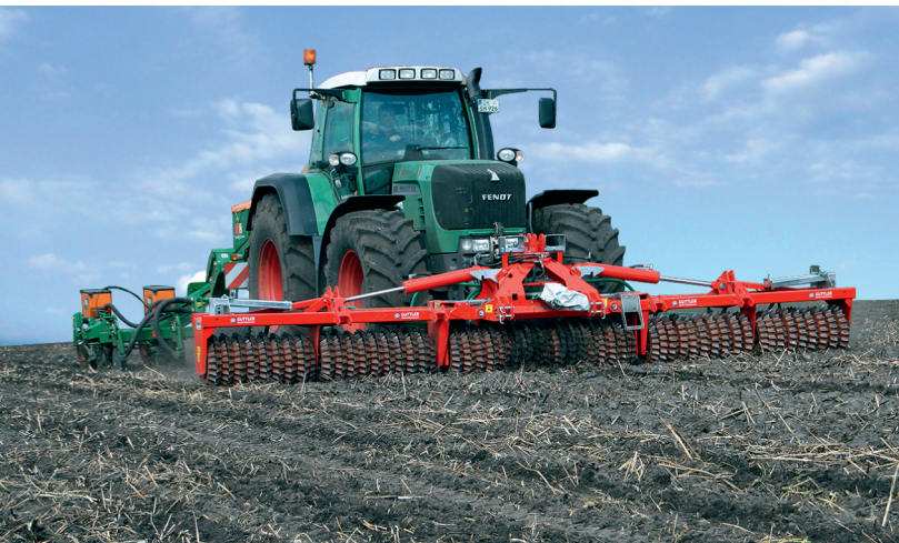
Matador 610 S zur Maissaat

Die Güttler-Walze mit dem Striegeleffekt lässt sich ganzjährig im Ackerbau nutzen: