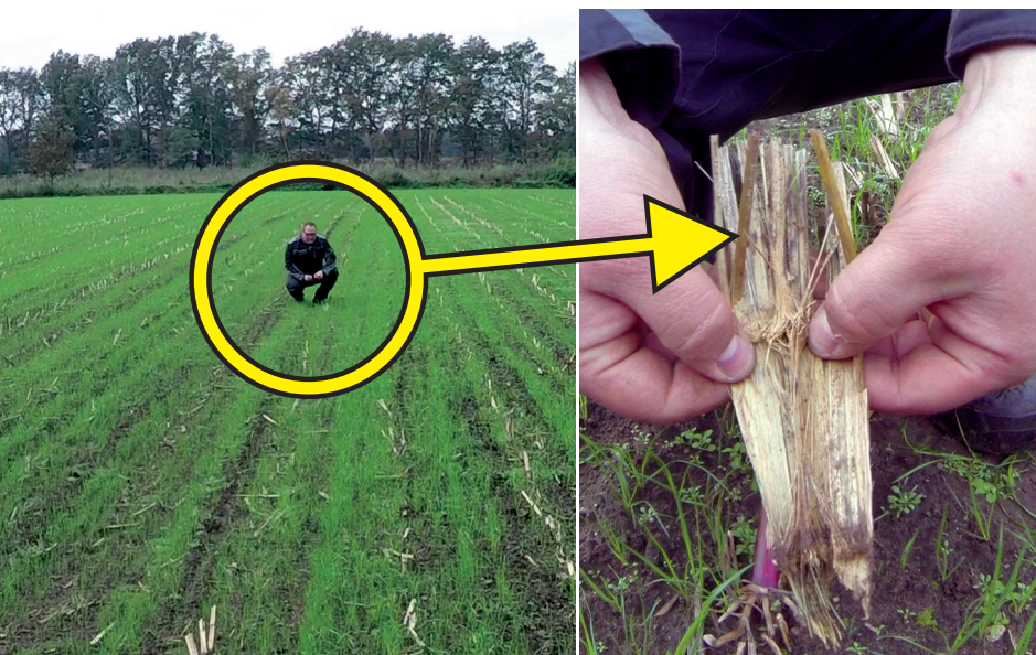
Im Herbst ...