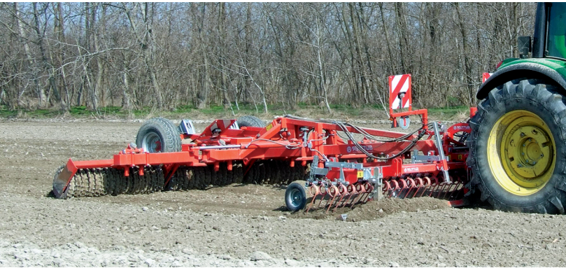
Walze Master 640 mit HarroFlex-Striegel