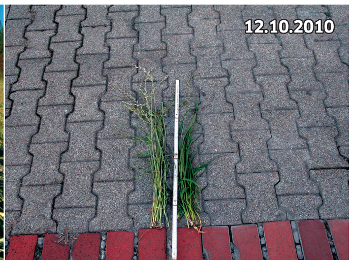
Der Weidelgras-Bestand ist zwischen 50-70 cm hoch!