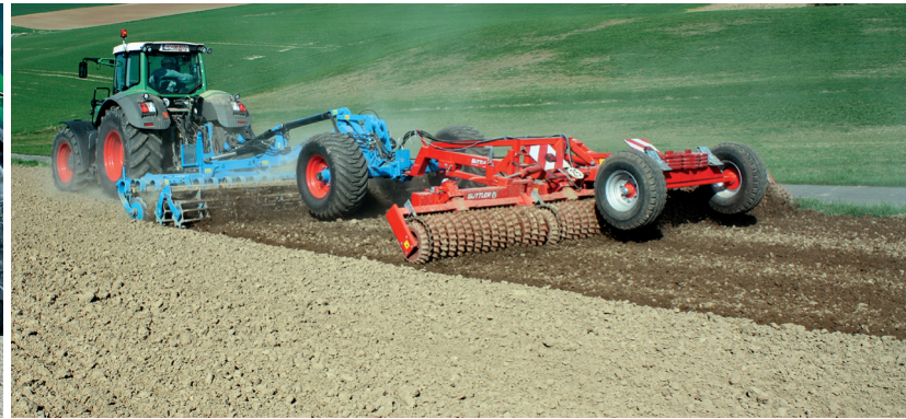
Walze Master 640 zur Saatbettbereitung für Zuckerrüben