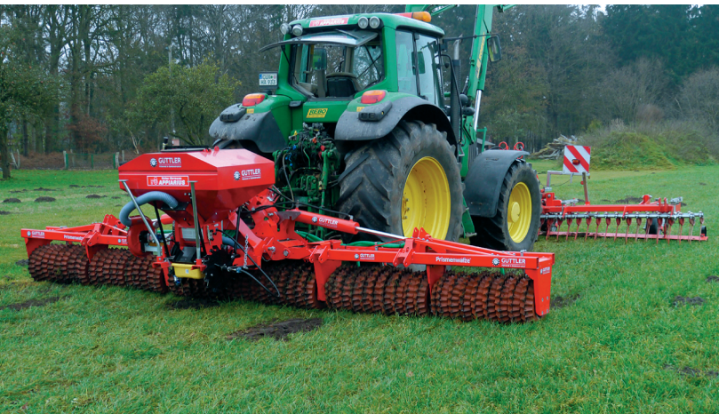
Matador 610 S zur Grünlandpflege und Nachsaat