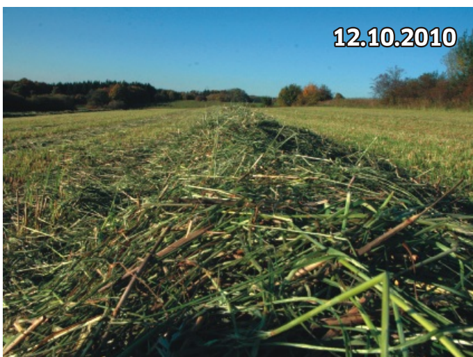
Standort: Schwäbische Alb, ca. 700 Meter ü.N.N.