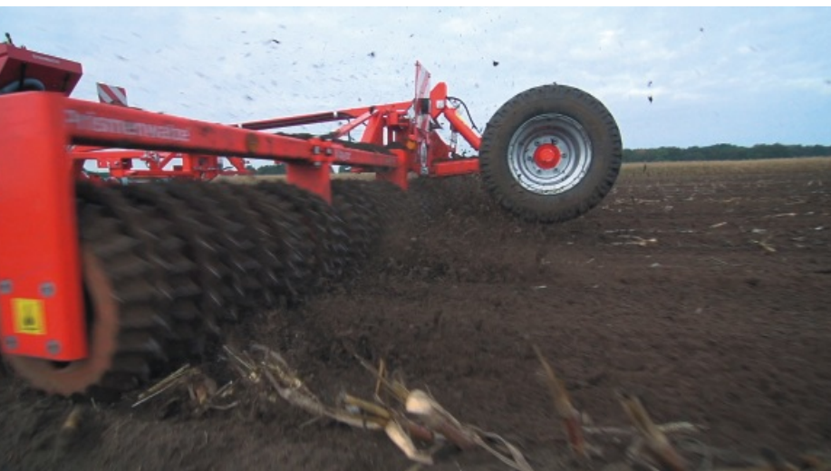
Exzellente Boden Anpassung