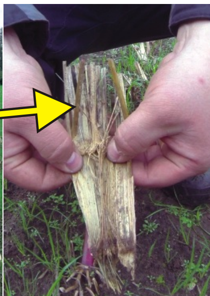
... im Frühjahr