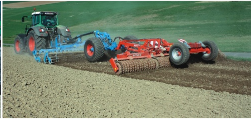
Walze Master 640 zur Saatbettbereitung für Zuckerrüben