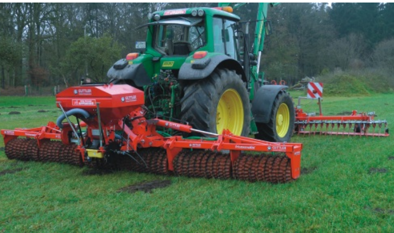
Matador 610 S zur Grünlandpflege und Nachsaat