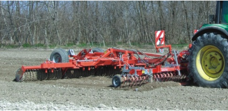
Walze Master 640 mit HarroFlex-Striegel