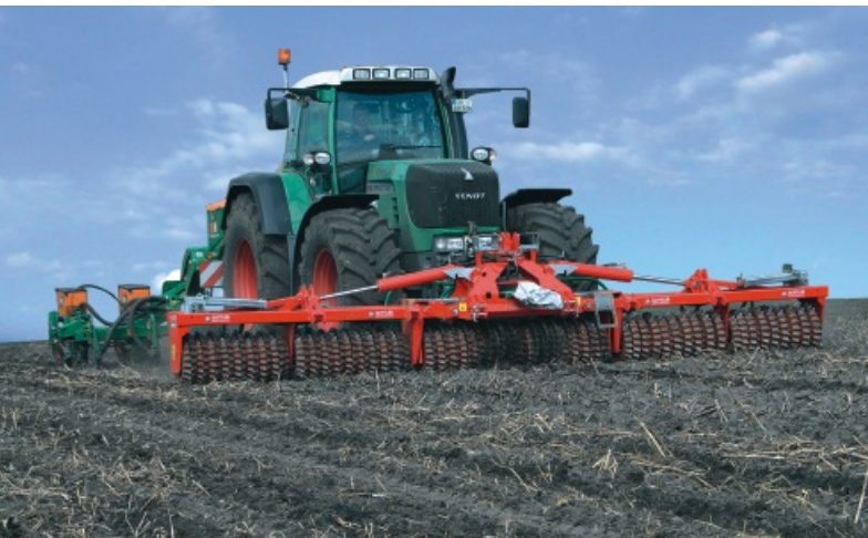
Matador 610 S zur Maissaat

Die Güttler-Walze mit dem Striegeleffekt lässt sich ganzjährig im Ackerbau nutzen: