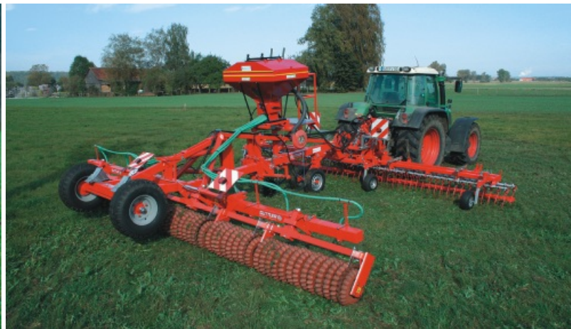
GreenMaster 770 = Master 770 + Sägerät + Grünlandstriegel