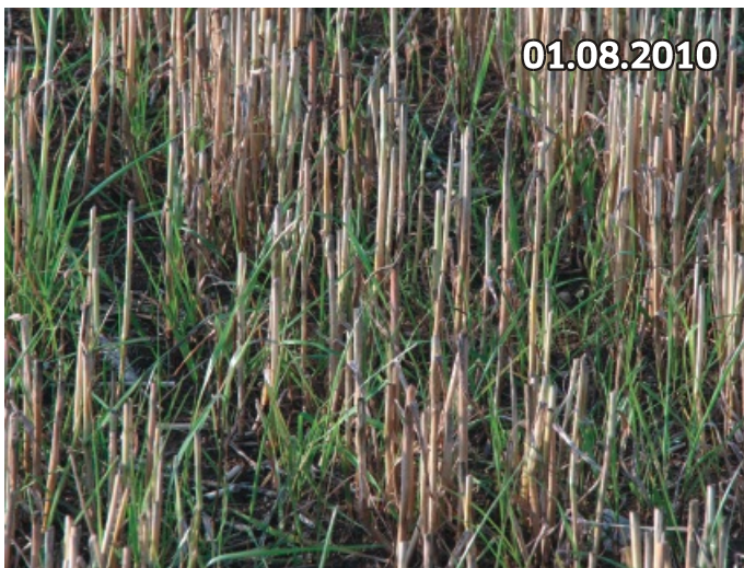
Nach der Ernte bekommt die Untersaat Luft und Licht und entwickelt sich prächtig. Einfacher und günstiger können Sie Bio-Masse nicht erzeugen!