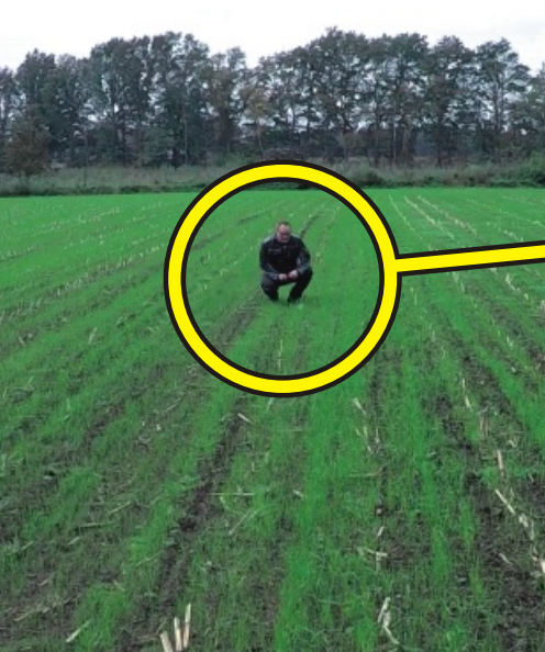
Im Herbst ...