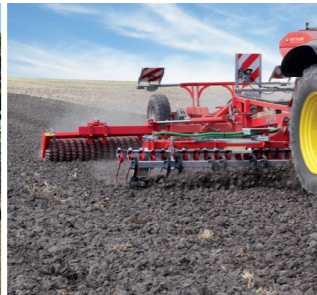
Bestellung von Zwischenfrüchten