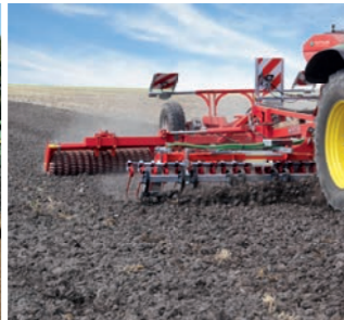
Bestellung von Zwischenfrüchten