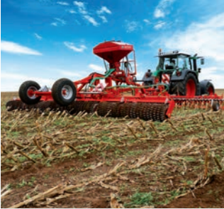
Bekämpfung - Maiszünsler nach Silomais