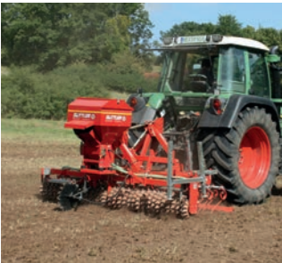
Umbruchlose Neuansaat von Grünland