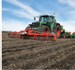
GÜTTLER-Walze in Front zur Maissaat