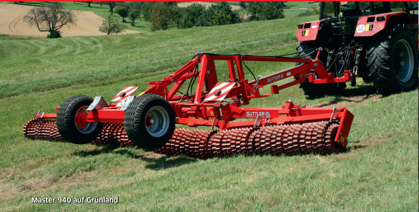
Master 940 auf Grünland