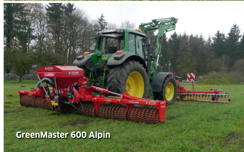
GreenMaster 600 Alpin