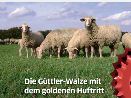
Die Güttler-Walze mit dem goldenen Huftritt