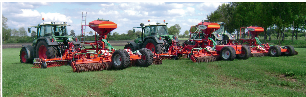
Drei der mittlerweile sechs GreenMaster der Hansa GmbH.