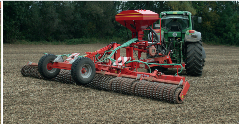
Walzen vor oder nach der Saat