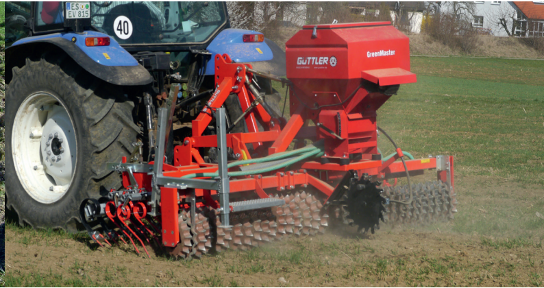
Wintersaaten zur Bestockung anregen, Untersaaten in Getreide etablieren.