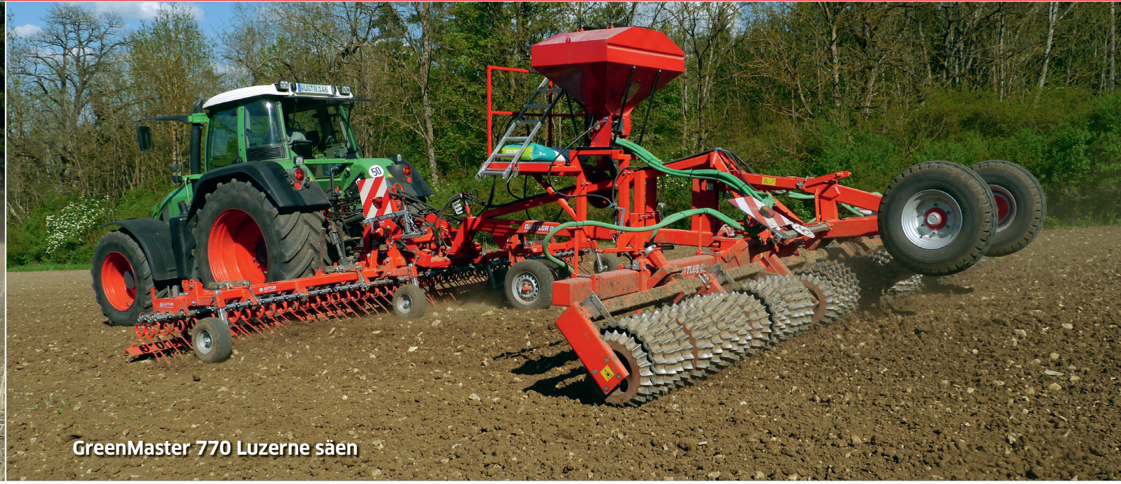
GreenMaster 770 Luzerne säen