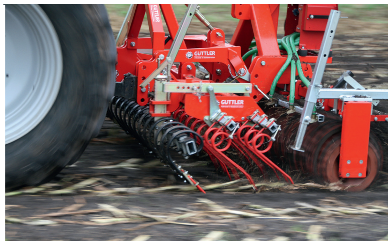
Maiszünsler bekämpfen, Winterbegrünung etablieren

Ausgeglichene Gewichtsverteilung, niedriger Schwerpunkt, sicheres Arbeiten.