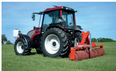
Grassamen (mit Kleinstreuer) ausstreuen u. mit Güttler-Walze in die Grasnarbe einwalzen.