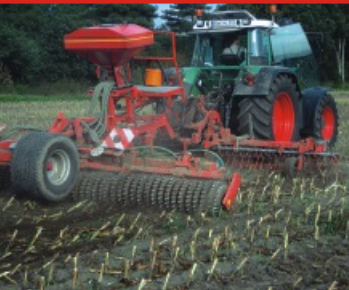
Bekämpfung des Maiszünslers nach Silomais