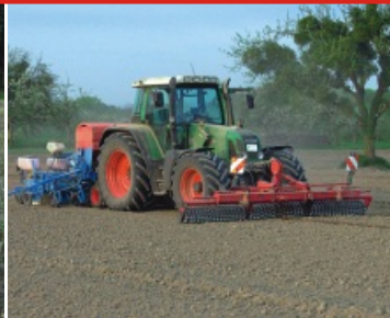
Güttler-Walze zur Maissaat