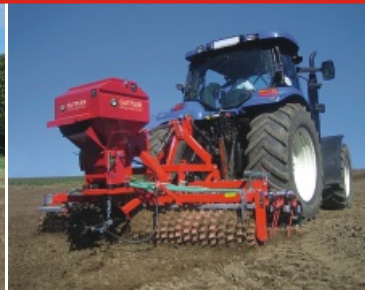
Bestellung von Zwischenfrucht