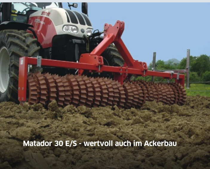
Matador 30 E/S - wertvoll auch im Ackerbau