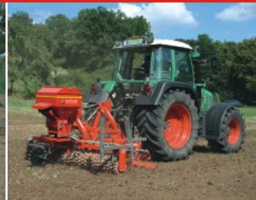
Umbruchlose Neuansaat von Grünland