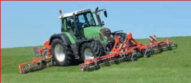
Güttler GreenMaster 600 Alpin