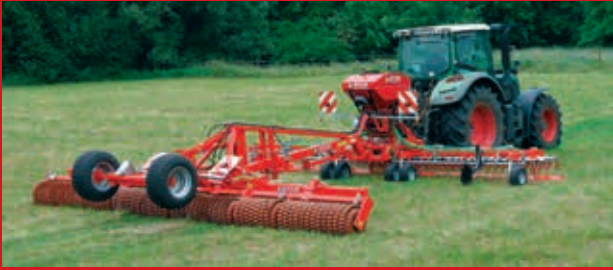
Güttler GreenSeeder 600 / 750 + Mayor oder Master 640 / 770