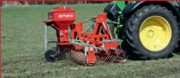
Güttler GreenMaster 3 m