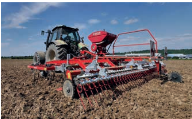
Mit Hilfe der optionalen Stützräder vorne lässt sich der Druck auf den RollFix bei feuchten Böden reduzieren. Bodenschonend!

Je trockener der Boden, desto stärker kann die Rückfestigung gewählt werden.