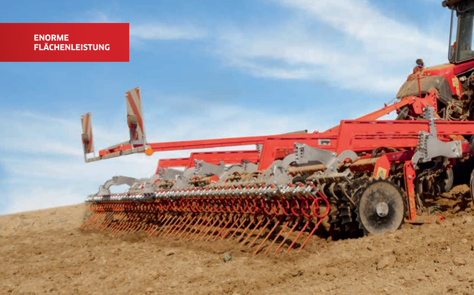
Super Maxx® 60-5 CULTI