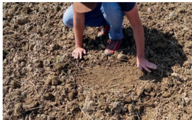
Ganzflächig durchgearbeitet mit Federzinken und Striegel – ein resultierender Strichabstand von nur 6,5 cm!