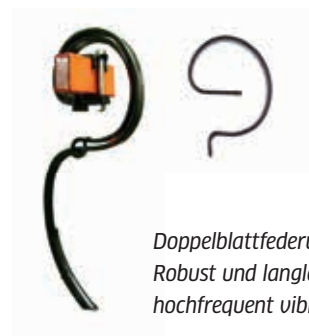
Doppelblattfederung: Robust und langlebig hochfrequent vibrierend