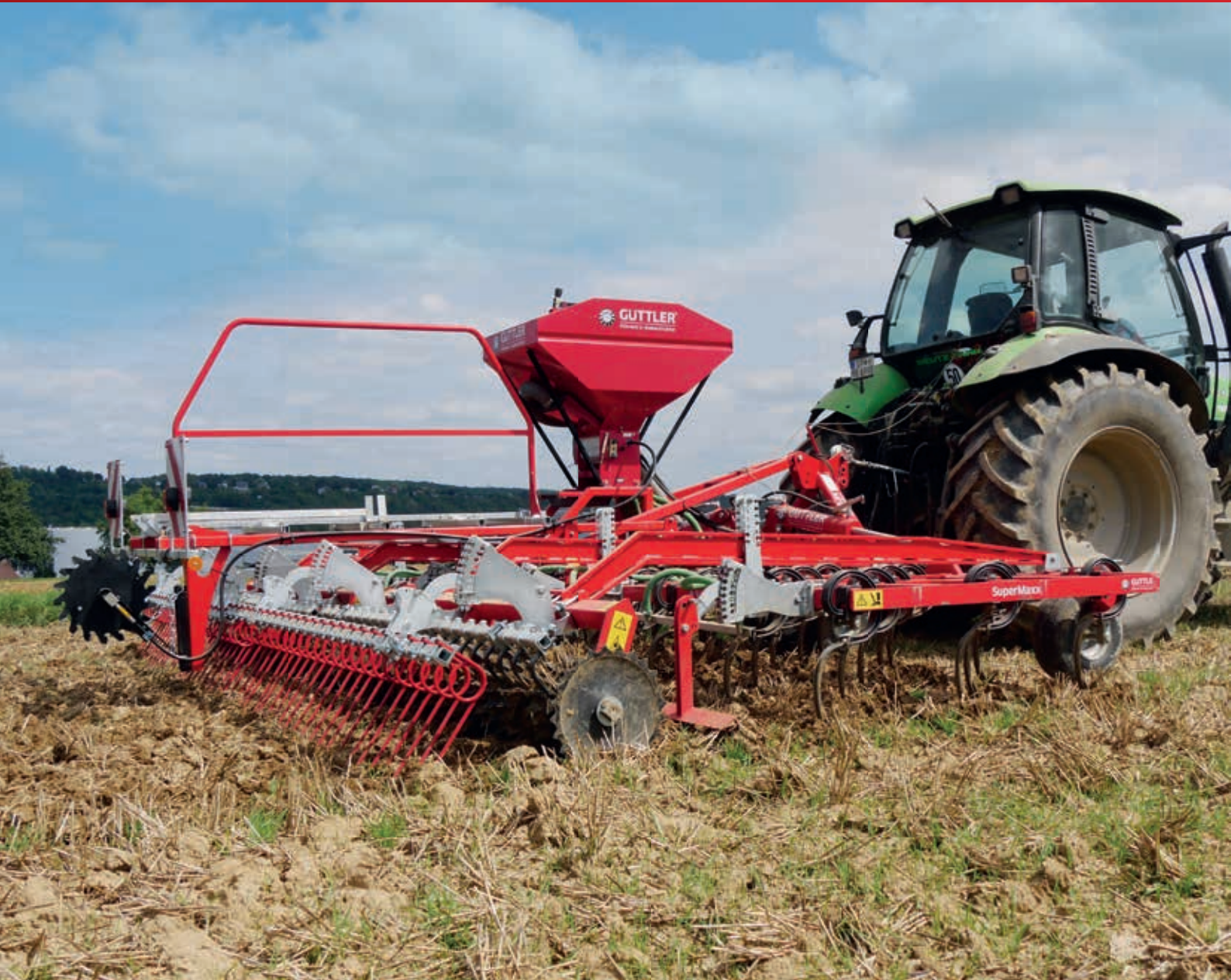
SuperMaxx ® 60-5 CULTI / Option: Stützräder Nachstriegel nach Walze und Sägerät für Zwischenfrüchte