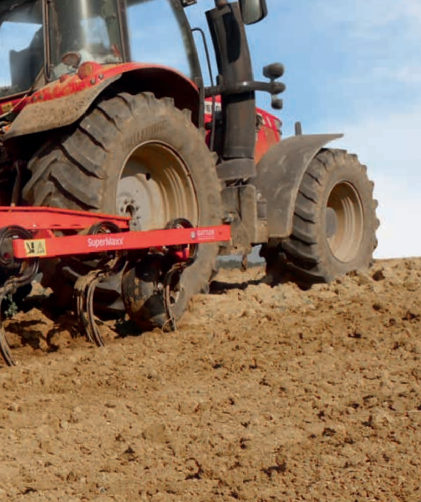
Option: Stützräder und Nachstriegel nach Walze