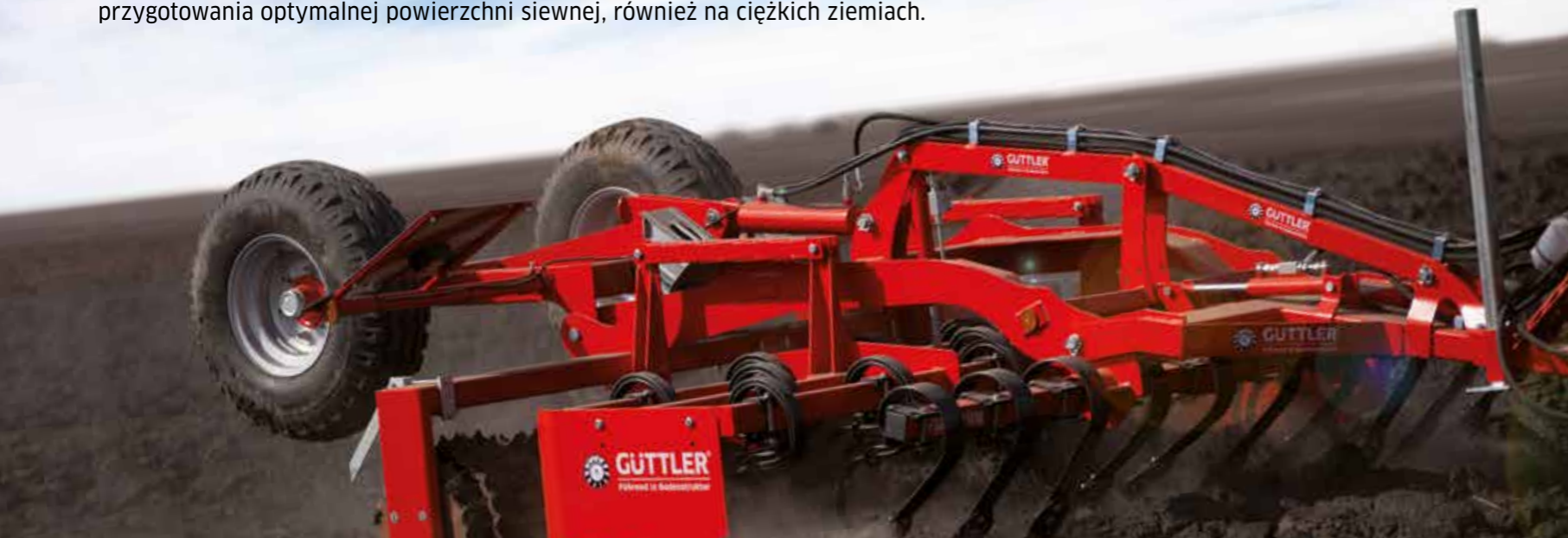
Feldmeister® LK 45

Wyrównywanie, spulchnianie, napowietrzanie, kruszenie i powtórne zagęszczanie – pięć etapów pracy w jednym przejeździe. Skuteczna, ciężka kombinacja do intensywnego przygotowania optymalnej powierzchni siewnej, również na ciężkich ziemiach.