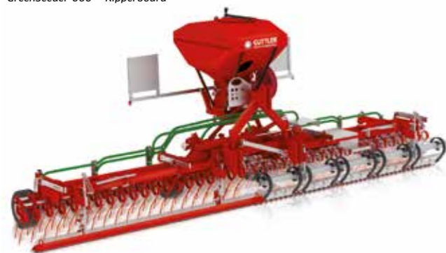
Do wyboru szyna wyrównująca lub Ripperboard