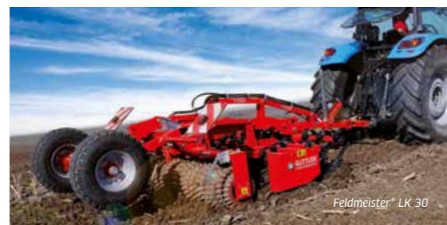
Feldmeister® LK 30

Mocne, wąskie zęby sprawdziły się przez te lata. Tylko w niewielkim stopniu wyciągają wilgotną ziemię, kamienie czy też pozostałości poźniwne na powierzchnię.