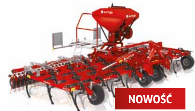
SuperMaxx® 60-5 + RollFix® + siewnik