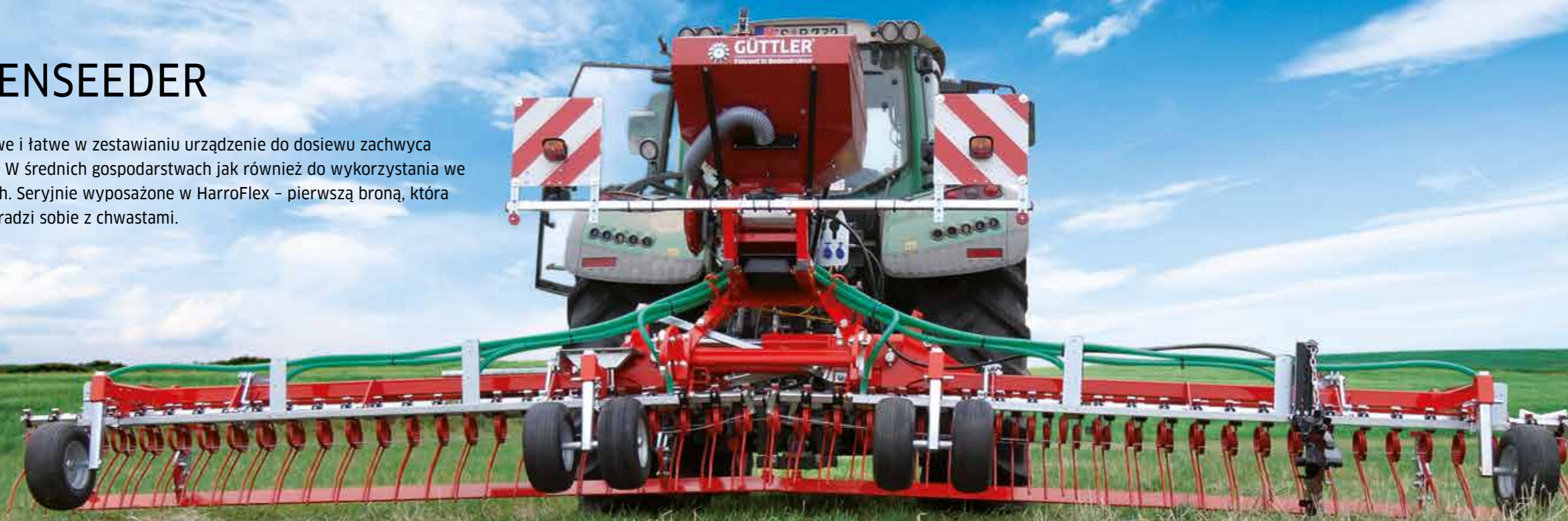
GreenSeeder 600 + Ripperboard

To modułowe i łatwe w zestawianiu urządzenie do dosiewu zachwyca wszystkich. W średnich gospodarstwach jak również do wykorzystania we wspólnotach. Seryjnie wyposażone w HarroFlex – pierwszą broną, która skutecznie radzi sobie z chwastami.