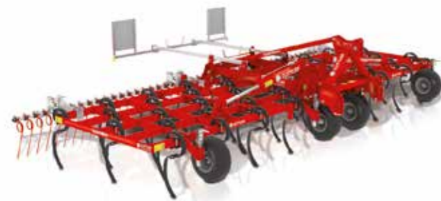
SuperMaxx® 60-5 + wiedege