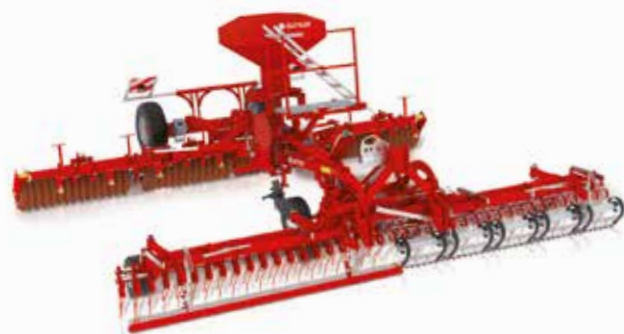
Egalisatiebalk of Ripperboard naar keuze

Wals en wiedege ook afzonderlijk inzetbaar