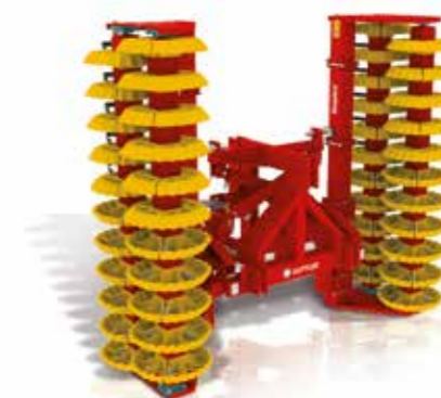
Hydraulisch opklapbaar – zo kunnen Ook, grote werkbreedtes, veilig getransporteerd en plaatsbesparend afgesteld worden.

Het tandenvoorzetstuk laat zich snel aan- of afbouwen. Op elk moment zijn de walsen ook achter inzetbaar, bijvoorbeeld achter dekoepel, voor het aanwalsen na het zaaien, op grasland, etc.