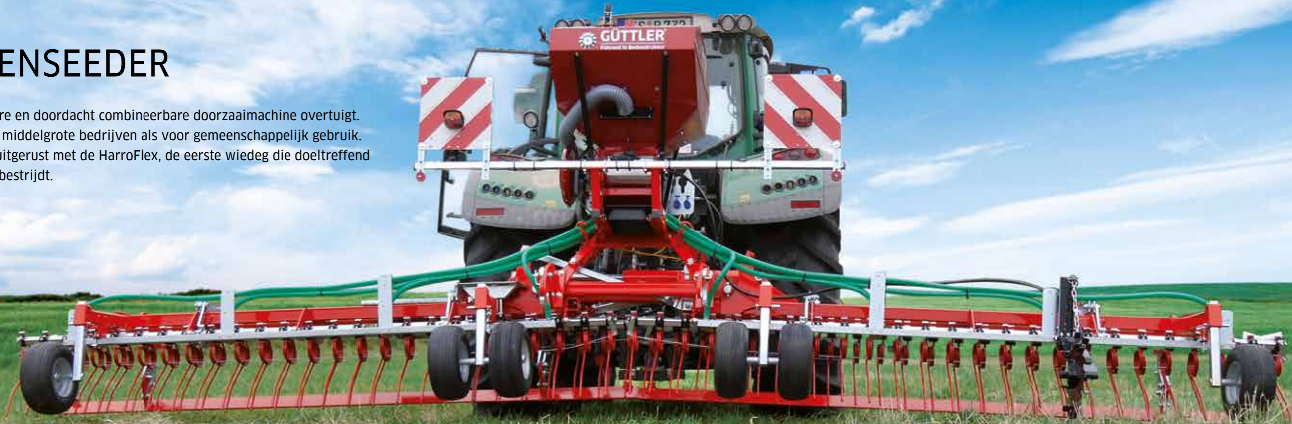
GreenSeeder 600 + Ripperboard

De modulaire en doordacht combineerbare doorzaamachine overtuigt. Zowel voor middelgrote bedrijven als voor gemeenschappelijk gebruik. Standaard uitgerust met de HarroFlex, de eerste wiedege die doeltreffend ruwbeemd bestrijdt.