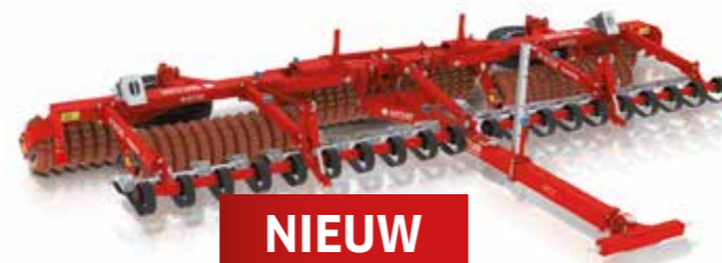
Offset® 640 (optioneel met FlatSpring)