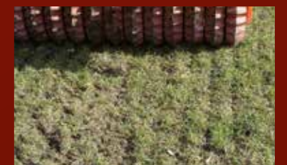
De Wals met de gouden hoefafdruk® zorgt voor een dichte grasmat.

Goed bemesten. Stalmest en drijfmest zijn organische meststoffen, ze bevatten belangrijke sporenelementen voor het grasland. Het is cruciaal deze mest dusdanig op te brengen dat de grasbestanden geen schade wordt toegebracht en de milieubelasting zo gering mogelijk blijft. Gunstige weersomstandigheden spelen daarbij een rol. Net als het gelijkmatige verdelen van de mest.