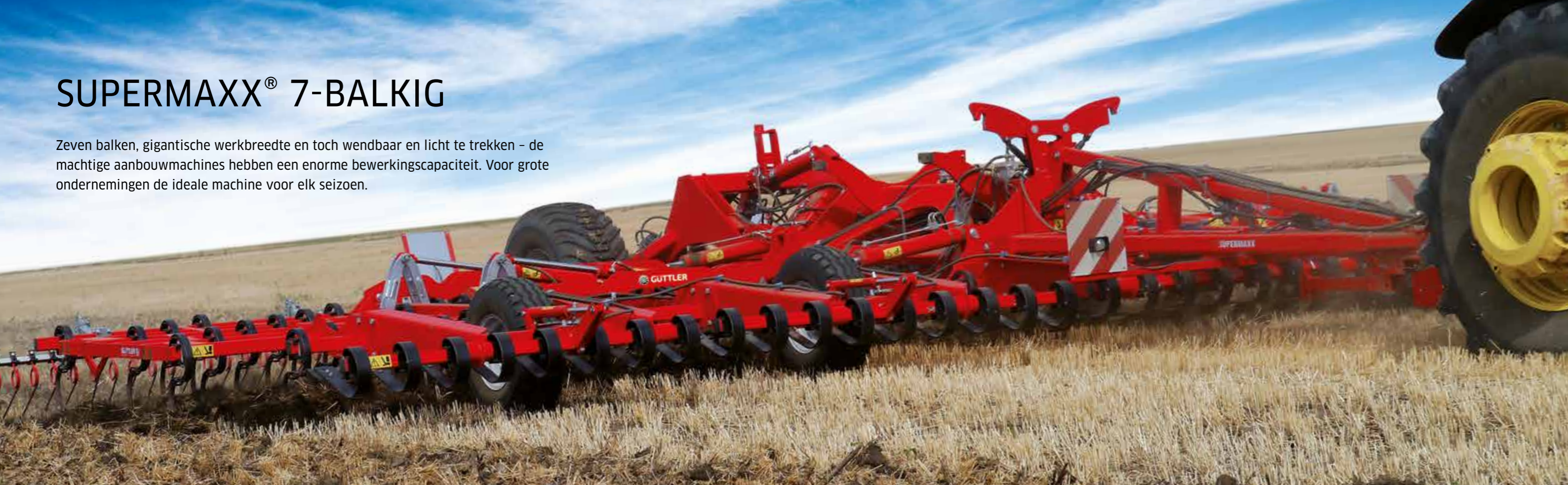
SuperMaxx® 900-7A + Simplex wals SX 45 Synthetik Ultra

Zeven balken, gigantische werkbreedte en toch wendbaar en licht te trekken – de machtige aanbouwmachines hebben een enorme beweringscapaciteit. Voor grote ondernemingen de ideale machine voor elk seizoen.