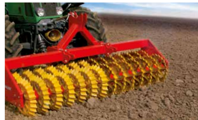
De zelfreinigende Duplex® Prismawalsen® geven zelfs zware kleigrond een losse kruimelstructuur.