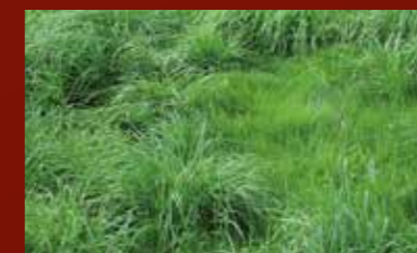
Ruwbeemd – een vaak onderschatte plaatsrover.

Doorzaaien en aanwalsen. Niet alleen de open plekken, maar ook de beluchte graszoden moeten zo snel mogelijk worden doorgezaaid. Het potentieel van natuurlijke zaden is hiervoor niet toereikend. De bewerkingen kunnen in één werkgang uitgevoerd worden: De bodem wordt met de wiedegtanden geopend, het zaaigoed met de pneumatische zaaimachine gelijkmatig verdeeld en met de Prismawals® vast in het zaaibed ingewerkt. Overigens: de ideale tijd