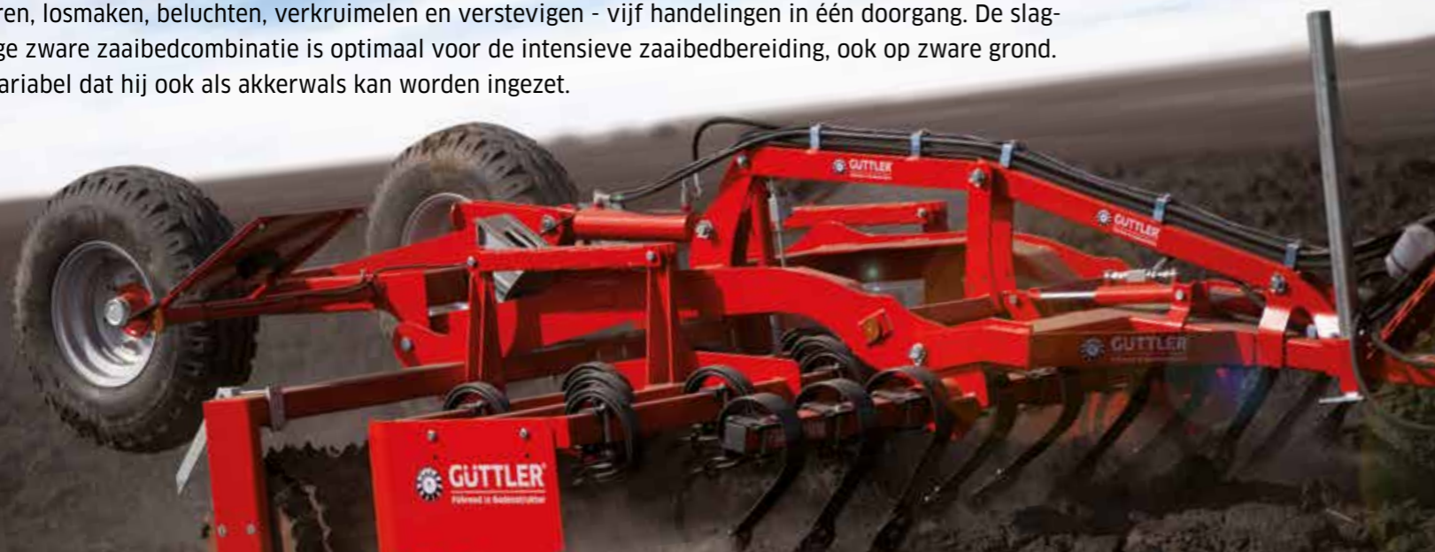
Feldmeister® LK 45

Egaliseren, losmaken, beluchten, verkrumelen en verstevigen - vijf handelingen in één doorgang. De slagkrachtige zware zaaibedcombinatie is optimaal voor de intensieve zaaibedbereiding, ook op zware grond. En zo variabel dat hij ook als akkerwals kan worden ingezet.