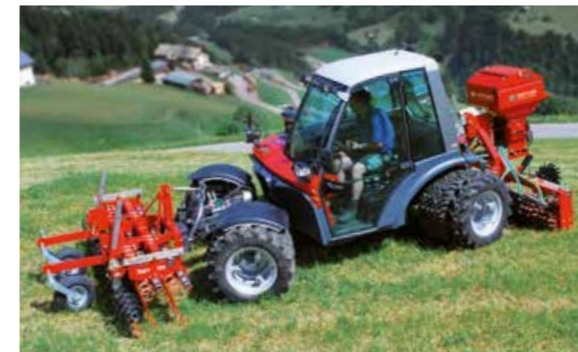
GreenMaster Alpin 300. Met de Metrac ook veilig op steile hellingen.