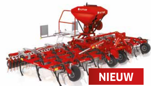
SuperMaxx® 60-5 + RollFix® + zaaimachine