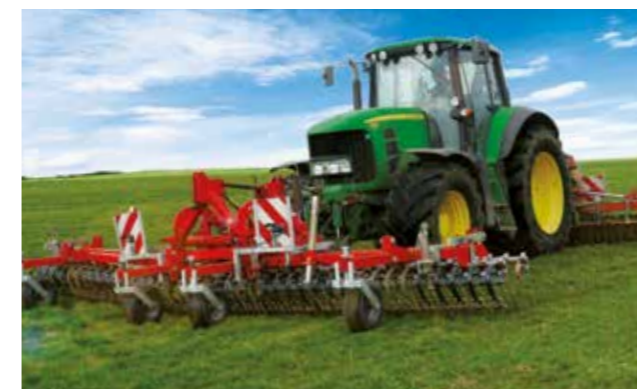
GreenMaster Alpin 600 - voor trekkers vanaf 100 pk. Ook ideaal in de kleine ruimte (greppels, omheind terrein).