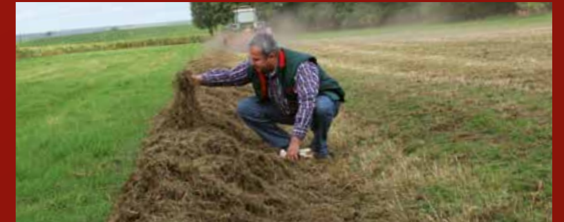
Am besten intensiv herausstriegeln, Schwaden und abfahren. 25 dt/ha an Gemeiner Rispe sind keine Seltenheit!

Open plekken weer snel sluiten. Uitwinteringsschade, doorgevroren graszoden, molshopen, wildschade of zodebeschadigingen door trekkersporen? Het maakt niet uit. Belangrijk is: open plekken moeten zo snel mogelijk worden gesloten, zodat onkruid geen kans krijgt. Voor het doorzaaien moet de grond goed worden voorbereid, de bodem iets vochtig zijn. Beluchten is na de winter vaak de eerste stap. Vervolgens egaliseren, een fijne structuur voor het zaaibed creëren, doorzaaien, inwalsen, de bodem verstevigen, de uitstoeling stimuleren.