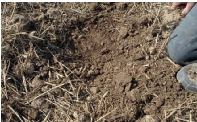
Nach dem zweiten Arbeitsgang: Vollständig durchgearbeitet, das Stroh ist angerottet, bricht und wird oberflächennah eingemischt.