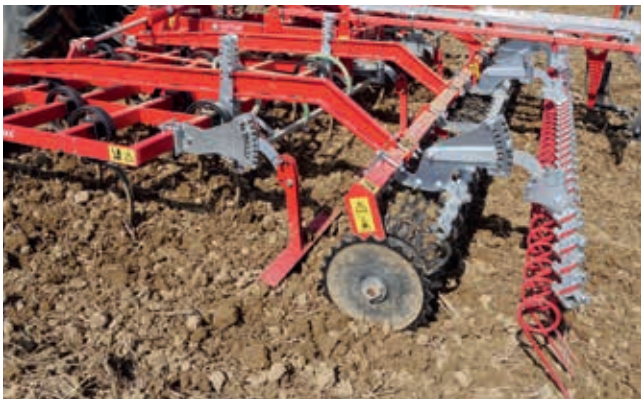
Option: Striegel nach der Walze zur mechanischen Unkrautbekämpfung.

Die Zinken des GÜTLER Super Maxx lösen Unkräuter aus dem Boden und fördern sie an die Oberfläche. Die nachfolgende Walze wird sie jedoch wieder andrücken, so daß sie u.U. weiter wachsen. Zur Unkrautbekämpfung empfiehlt ich deshalb der Nachstriegel, der die Unkräuter zuverlässig an die Oberfläche fördert, wo sie vertrocknen. Bei der Bearbeitung werden gleichzeitig Unkrautsamen zum Keimen angeregt. Ein nochmaliger Durchgang einige Zeit später beseitigt auch die frisch gekeimten Unkräuter und bewirkt so eine regelrechte „Unkrautkur“.