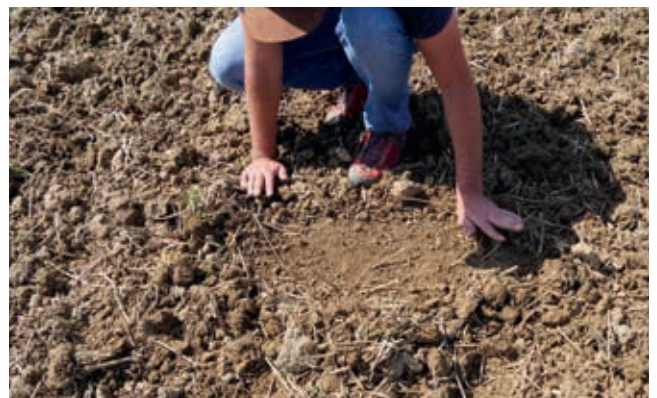
Ganzflächig durchgearbeitet mit Federzinken und Striegel – ein resultierender Strichabstand von nur 6,5 cm!