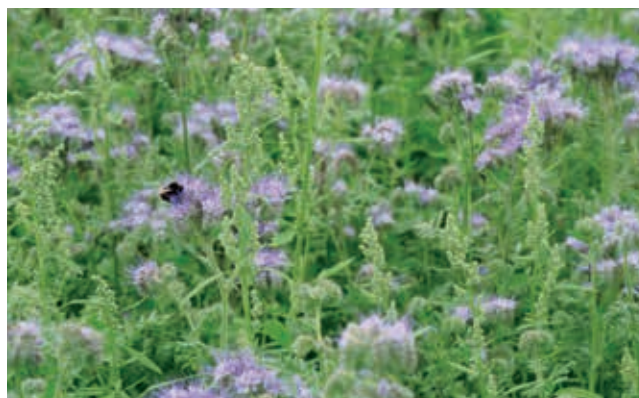
... auch als Gemenge.