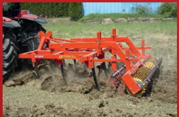
Kluten sind selbst gemacht! Weder wachsen sie im Boden, noch fallen sie vom Himmel!