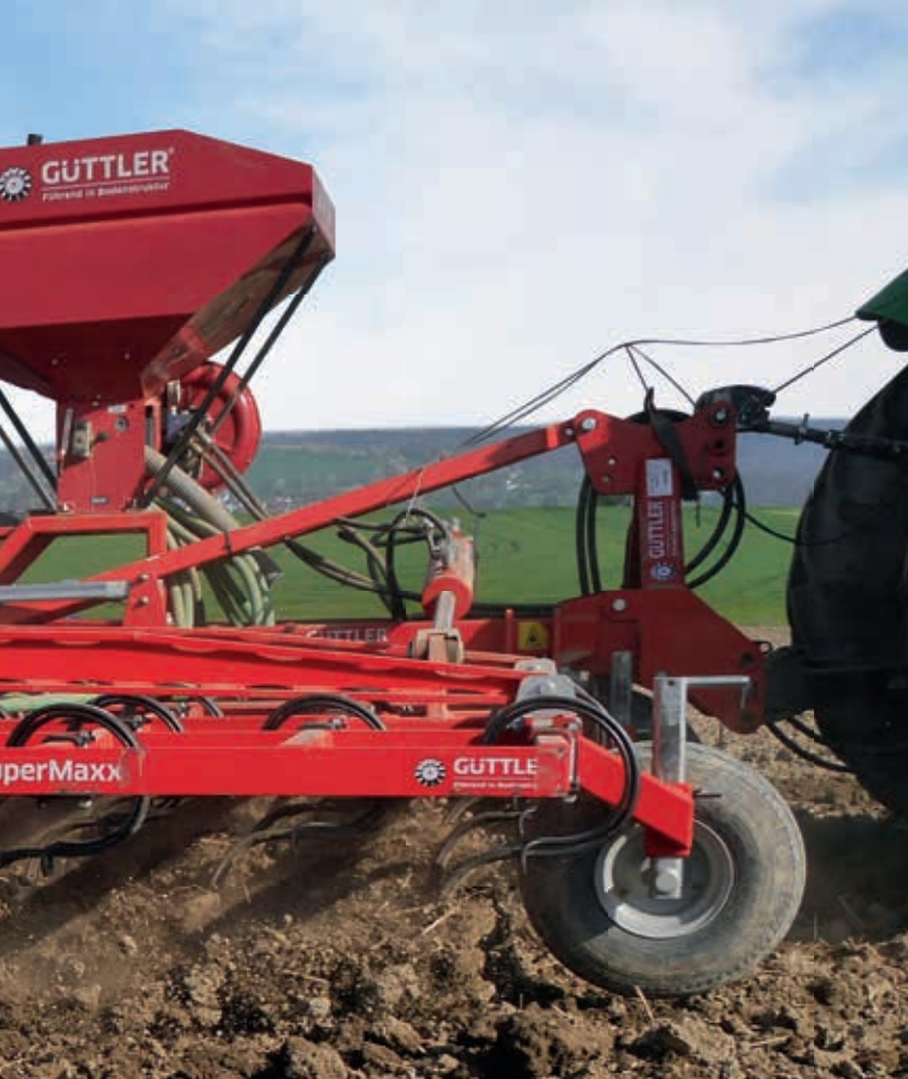
Option: Stützräder und Sägerät für Zwischenfrüchte