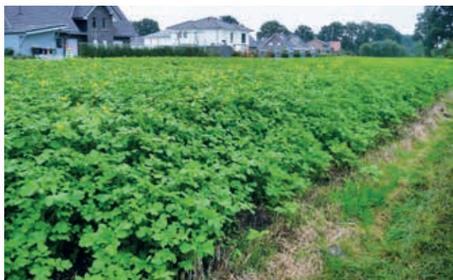
So gelingen Zwischenfrüchte ...