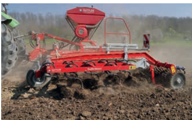
Die Planierplanke vor der Walze (Serie) ...

Vor der Walze sorgt eine Planierplanke für perfektes Einebnen. Sie ist leicht einzustellen und wenig verstopfungsanfällig. Zur Stoppelbearbeitung wird sie mit einem Handgriff außer Dienst gestellt.