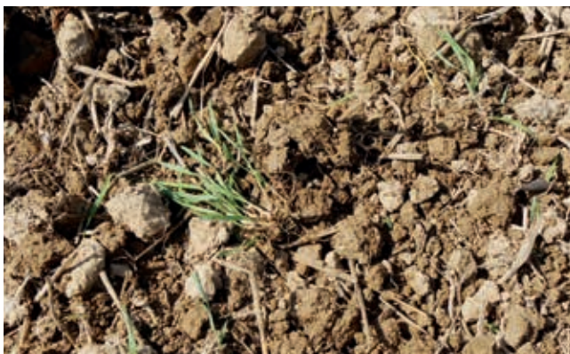
Der Nachstriegel legt die von den Federzinken gelösten Unkräuter lose an der Oberfläche ab, wo sie vertrocknen.

verriegelt werden, so daß sie auf derselben Arbeitstiefe laufen wie die Super Maxx®-Zinken. Man halbiert somit den Strichabstand auf 6,5 cm und erzielt ein vollständiges Durcharbeiten! Die hochfrequenten Schwingungen der Super Maxx®-Zinken sowie der Striegel-Zinken bewirken den Rest.