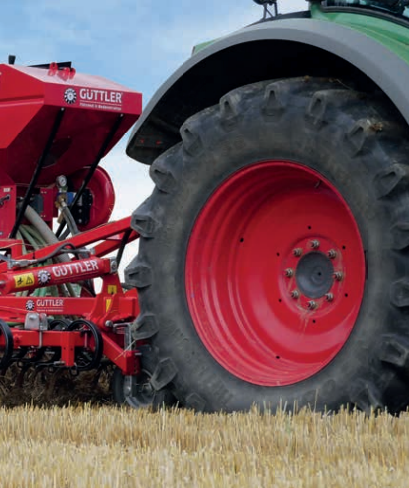
Option: Stützräder und Sägerät für Zwischenfrüchte