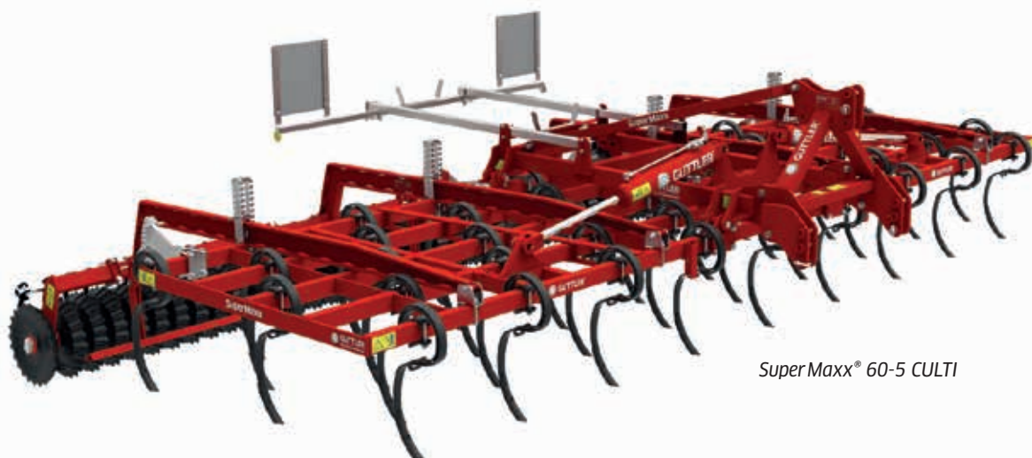
SuperMaxx® 60-5 CULTI