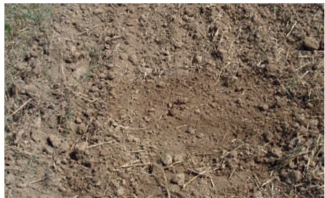
Ein feinkrümeliges, abgesetztes Saatbett, das Stroh ist weiter verrottet und eingemischt. Ein ideales Saatbett für Zwischenfrüchte!