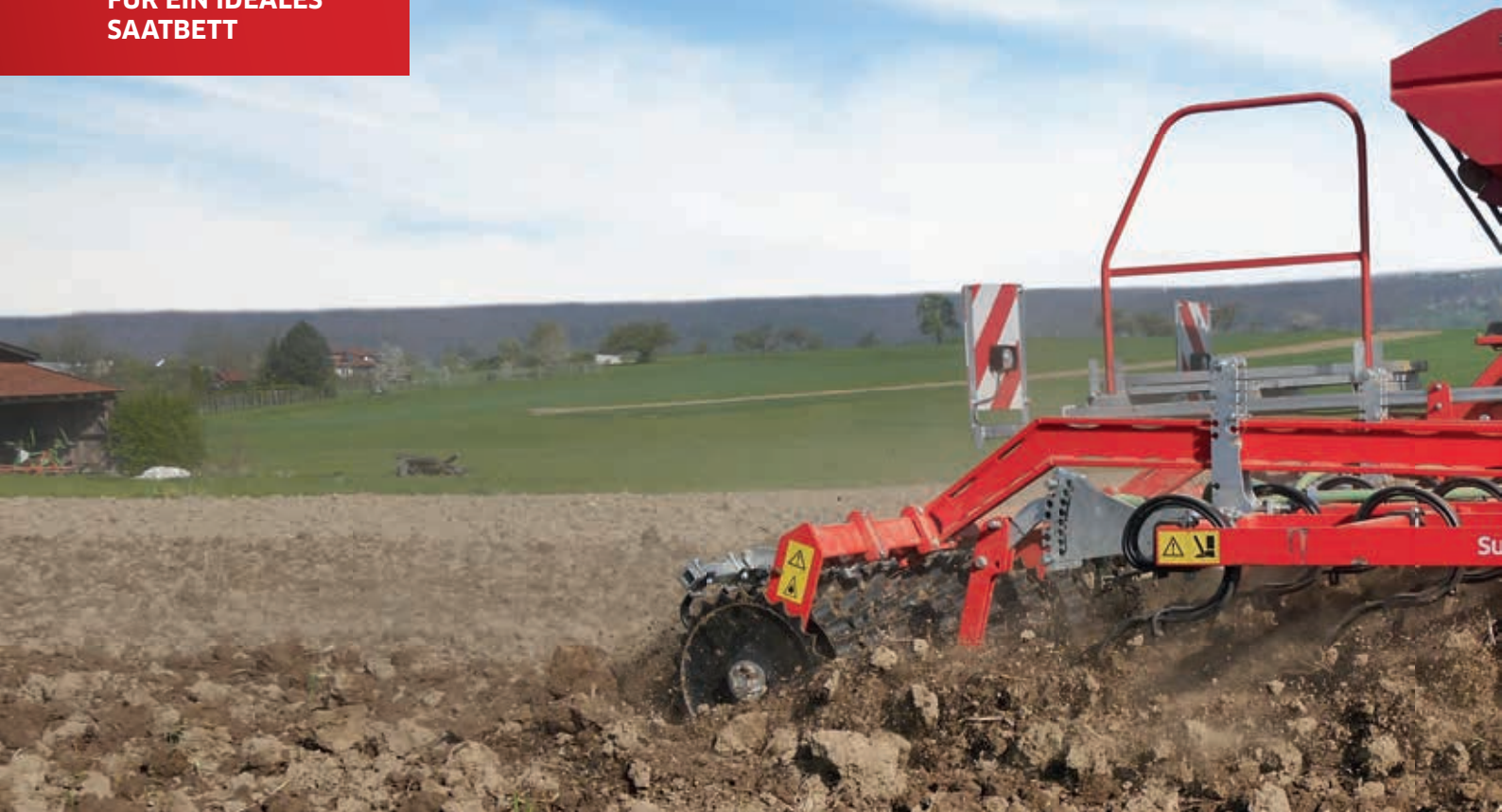
Super Maxx® 60-5 CULTI