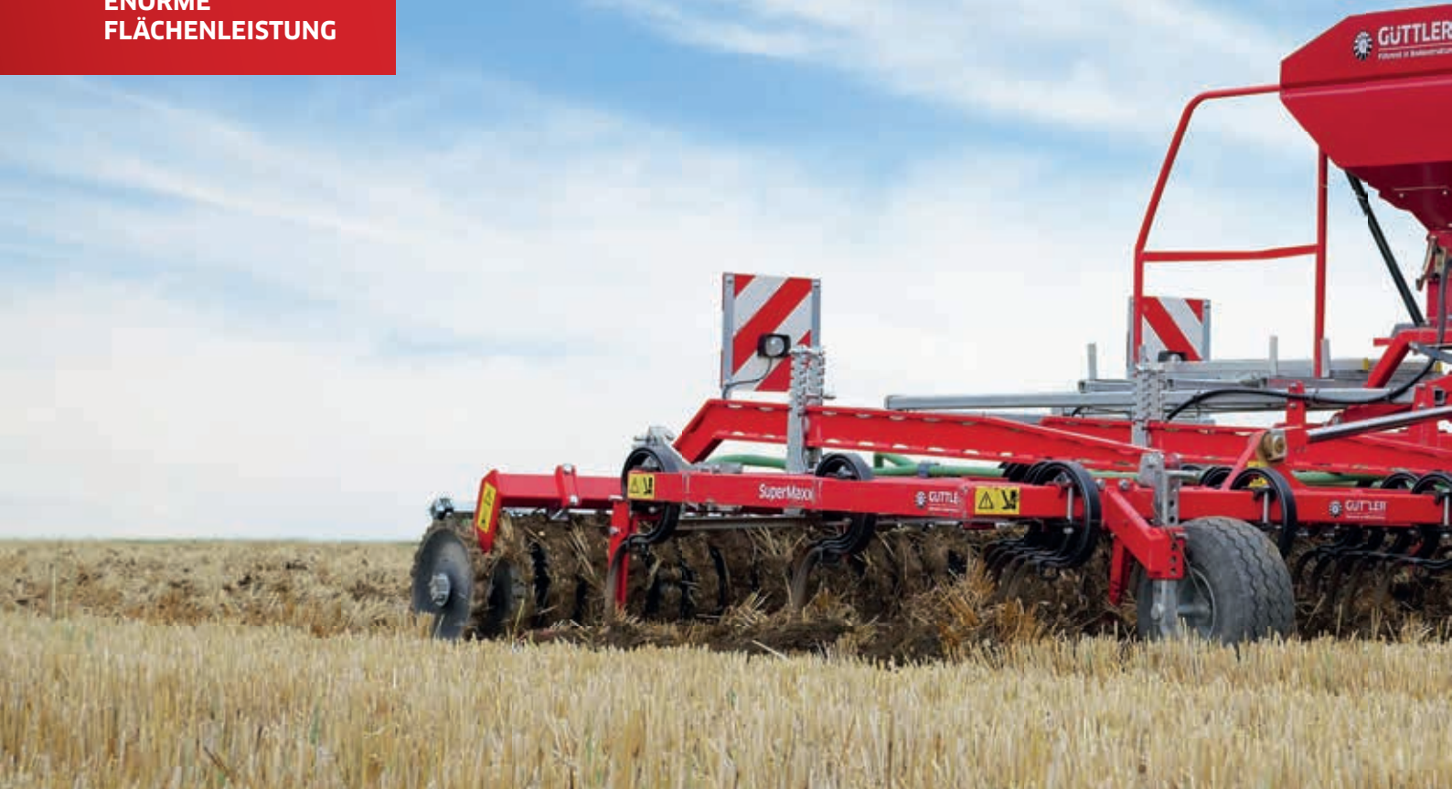
Super Maxx® 60-5 CULTI