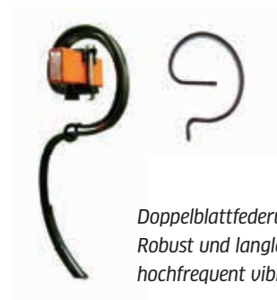
Doppelblattfederung: Robust und langlebig hochfrequent vibrierend