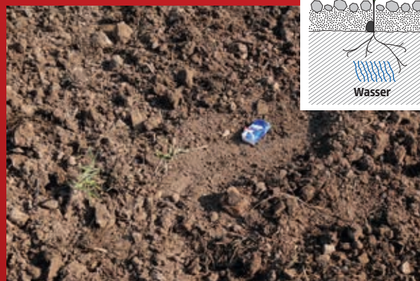
SuperMaxx® CULTI : Saatbett, unten fest – oben locker Feinerde unten (Sameneinbettung) Grobkrümel oben (Verschlammungsschutz)