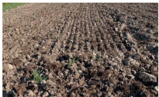
... mischt, krümelt und ebnet das Saatbett perfekt ein.