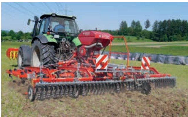
Die hochfrequent vibrierenden Zinken arbeiten in hartem Boden wie ein Presslufthammer.

Die Rahmen sind entsprechend robust gebaut, um diesen hohen Anforderungen gerecht zu werden.