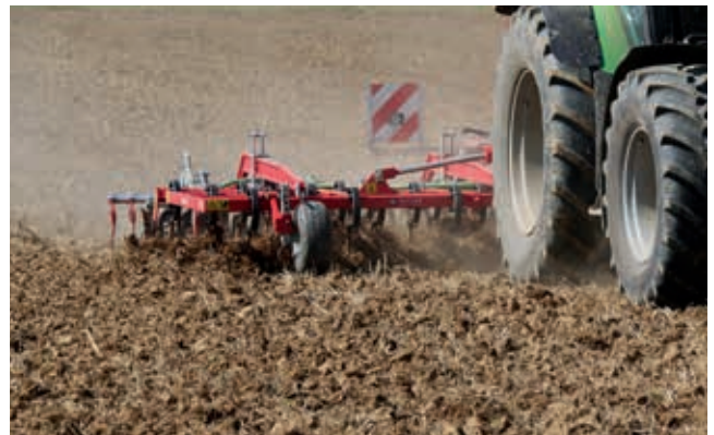
Zur Unkrautbekämpfung können Stützräder vorne hilfreich ein, um Druck von der RollFix-Walze zu nehmen.

Je nach Einstellung fangen sie mehr oder weniger Gerätegewicht ab, so daß die Roll-Fix-Walze die von den Zinken gelösten Unkräuter nur leicht andrückt. Der Nachstriegel tut sich dann wesentlich leichter damit, die Unkräuter an der Oberfläche abzulegen. Je feuchter und bindiger der Boden bei der Bearbeitung ist, desto wertvoller werden die Stützräder. Im Extremfall übernehmen sie das Gerätegewicht zur Gänze, und die leichte Roll-Fix-Walze rollt nur unter ihrem Eigengewicht ab.