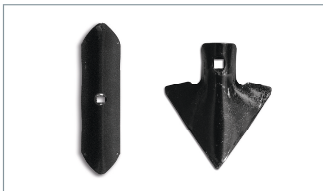
Auf Wunsch: Gänsefuß-Schare 150 mm breit.