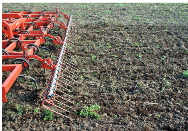
Die Zinken lösen den Bewuchs, der Striegel legt das Unkraut an der Oberfläche ab, so dass es vertrocknet.