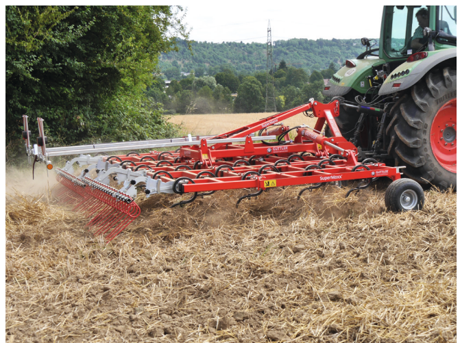
7-balkig für noch mehr Durchgang.