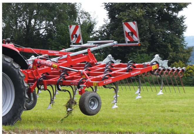
Leicht und wendig, auch für leichte Schlepper geeignet. Auf Wunsch: Gänsefuß-Schare 150 mm breit.