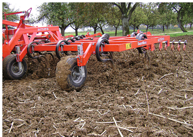
Nasse Böden ablüften lassen.