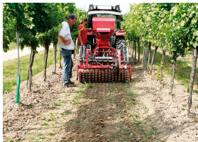
Ansät von Blühstreifen in offenen Fahrgassen. Flaches wassersparendes Bearbeiten.