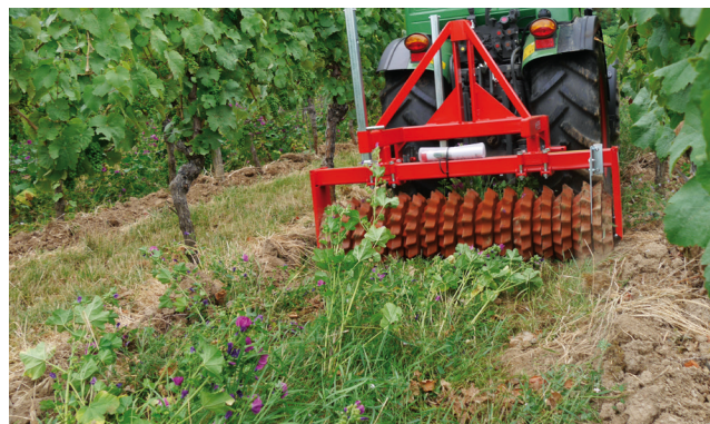
Niedrige Intensitätsstufe: Wachstum hemmen durch walzen.