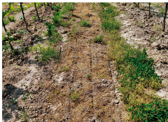
Die unterschchnittene Pflanzendecke stirbt ab und schützt den Boden vor Sonneneinstrahlung, Austrocknen und Erosion.