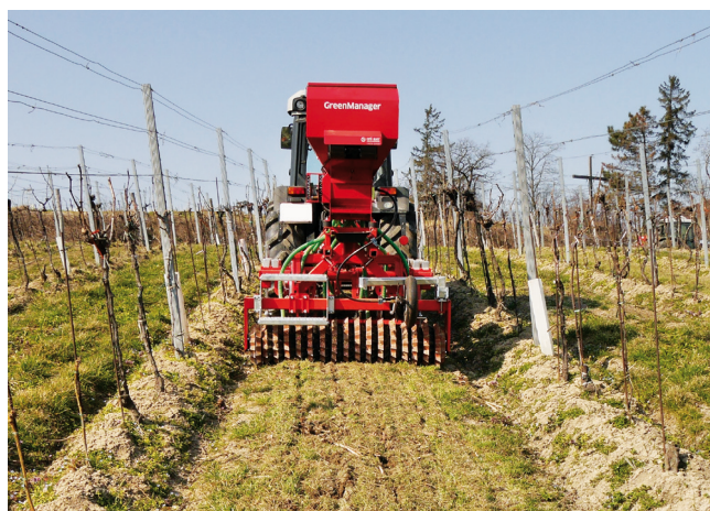
Der Grubber unterfährt den Bestand ohne zu mischen. Der Boden bleibt bedeckt: Wassersparend, Erosionsschutz.