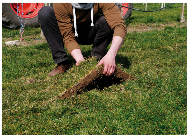
Höchste Intensitätsstufe: Wachstum stoppen durch Unterschneiden. Sollte es danach ausgiebig regnen, kann sich die Begrünung regenerieren und weiter wachsen. Sie können nichts falsch machen.