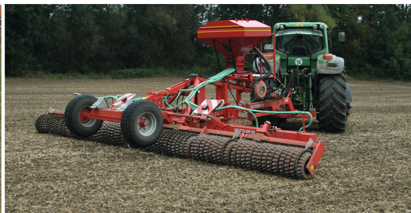
Compactar el suelo antes y después de la siembra