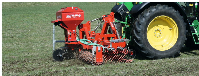
Aplicación del estiércol con el GreenMaster 300