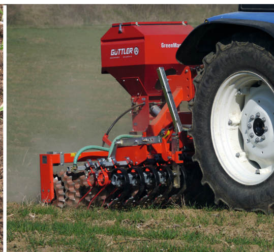
Establecer cultivos intercalados entre los cereales invernales y estimular la macollaje.