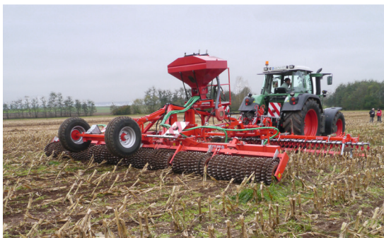
Luchar contra el barrenador del maíz.

Las máquinas se rentabilizan. Cada máquina esta labrando varios cientos hectáreas por año.