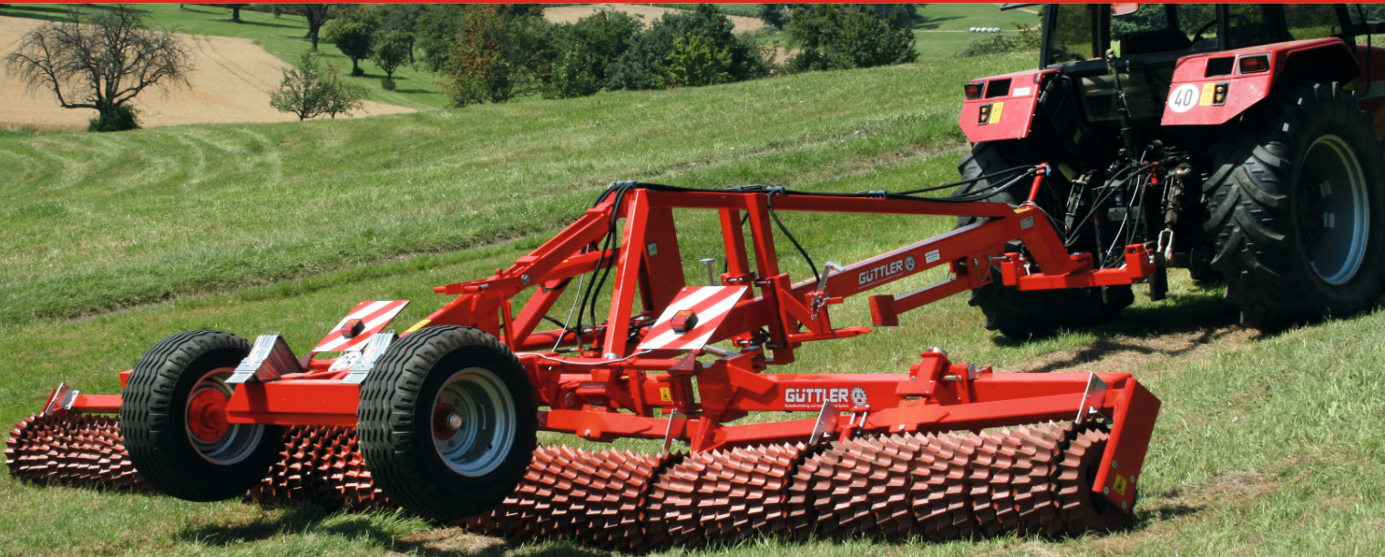
Master 940 en las praderas