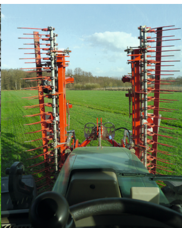
Distribución de peso compensada