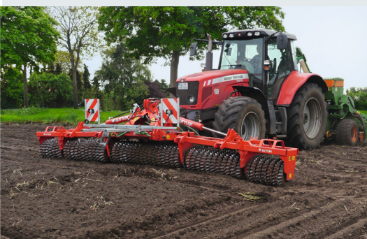
En modo frontal para sembrar maíz

Uso múltiple, utilización durante todo el año, amortización a corto plazo