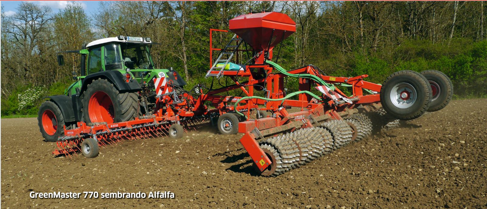
GreenMaster 770 sembrando Alfalfa