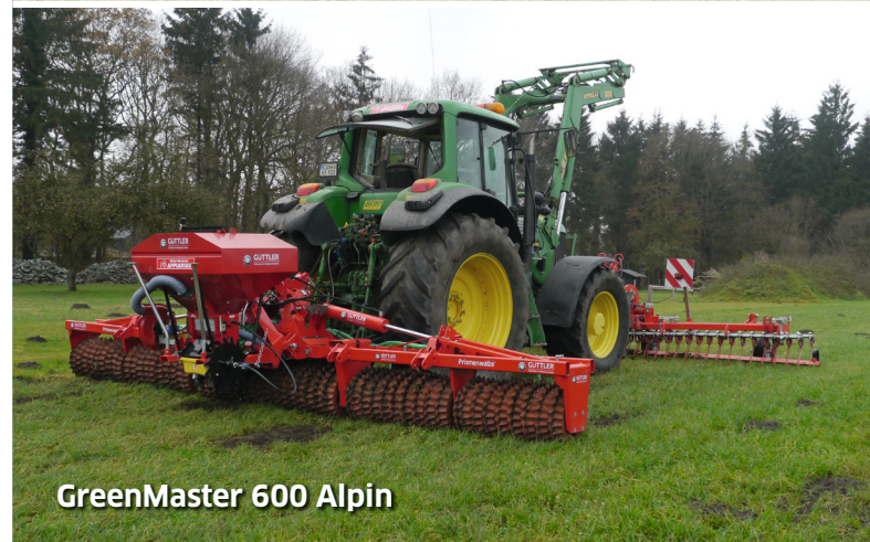
GreenMaster 600 Alpin