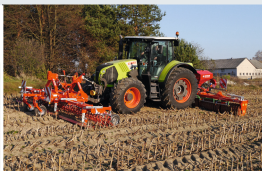
Lucha contra el gusano barrenador y sembrar pastizales con alta eficacia