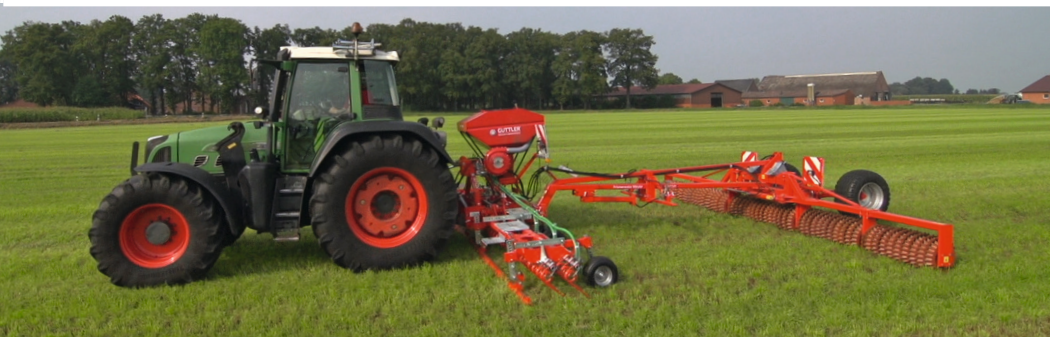
GreenSeeder 600 con Mayor 640 acoplado