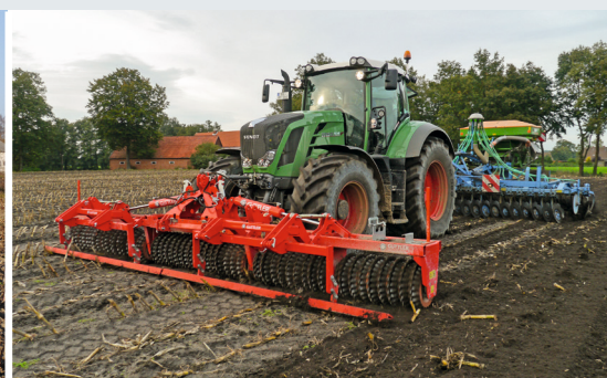
En modo frontal lucha contra el gusano barrenador, y en la parte trasera trabajar la paja y resembrar