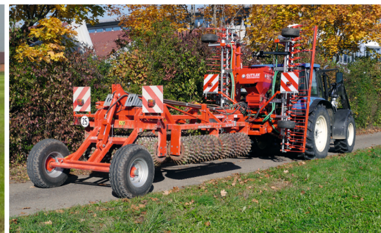
Ancho de transporte 2,5m