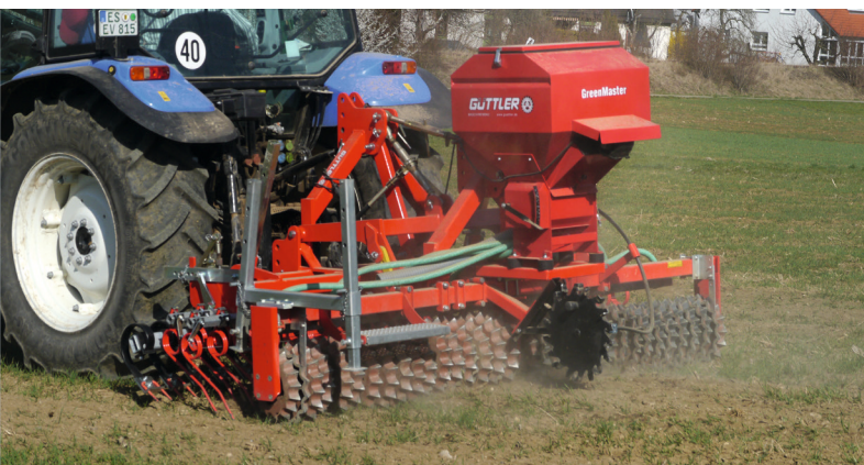
Estimular la macollaje de las siembras invernales Establecer cultivos intercalados en cereal