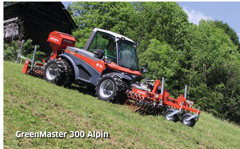
GreenMaster 300 Alpin

Con una densidad de siembra de 5kg/hectárea de pastizal y una gramínea de 2,5 gramos logra Vd. 200 semillas por metro cuadrado.