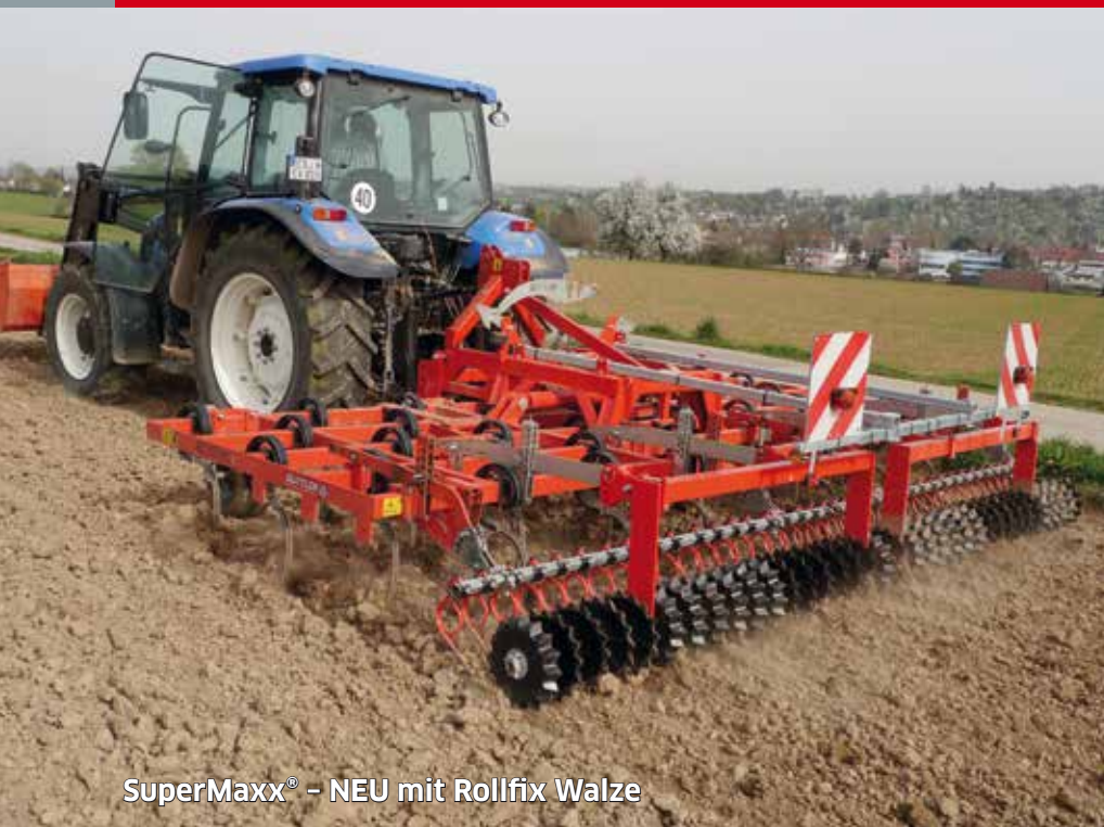
SuperMaxx® – NEU mit Rollfix Walze