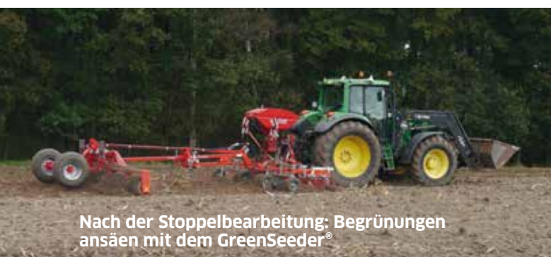
Nach der Stoppelbearbeitung: Begrünungen ansäen mit dem GreenSeeder®