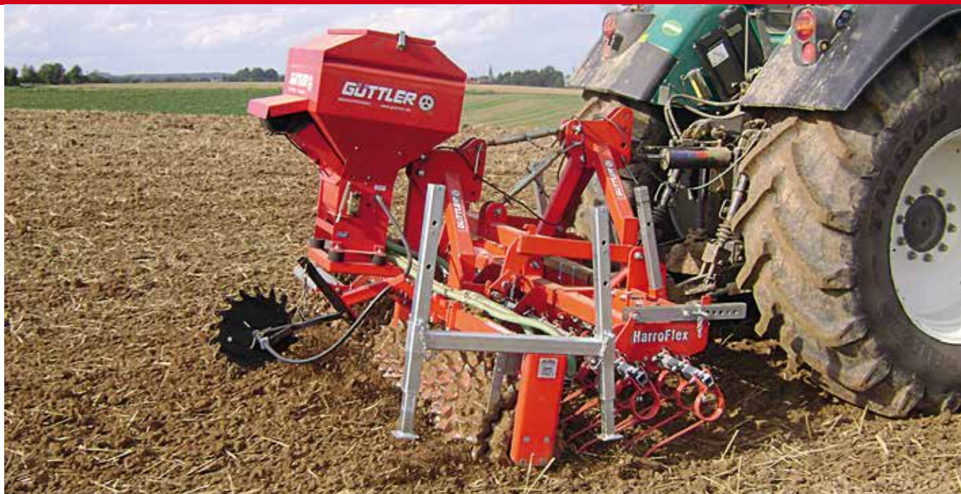
GreenMaster®: mit hoher Schlagkraft – so gelingen Zwischenfrüchte