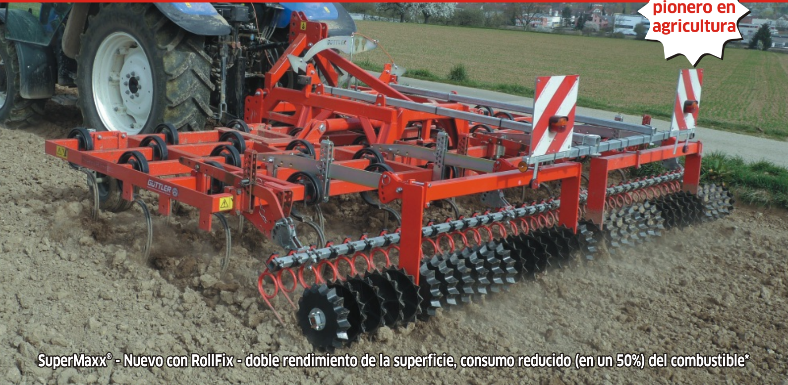
SuperMaxx® - Nuevo con RollFix - doble rendimiento de la superficie, consumo reducido (en un 50%) del combustible*