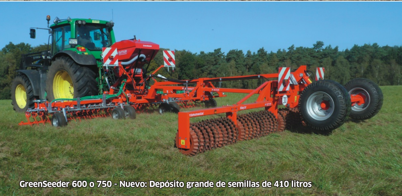
GreenSeeder 600 o 750 - Nuevo: Depósito grande de semillas de 410 litros