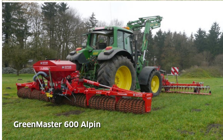
GreenMaster 600 Alpin