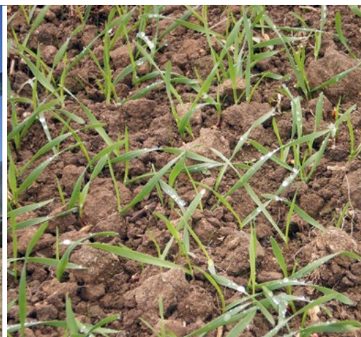
Triticale mit dem GreenMaster bestellt