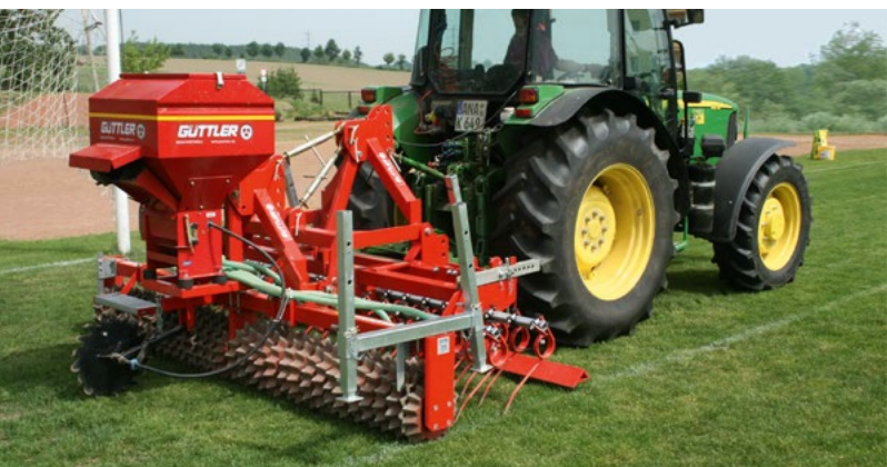
Pflege von Sportrasen: Was auf Grünland richtig ist, kann auf Sportrasen nicht falsch sein.