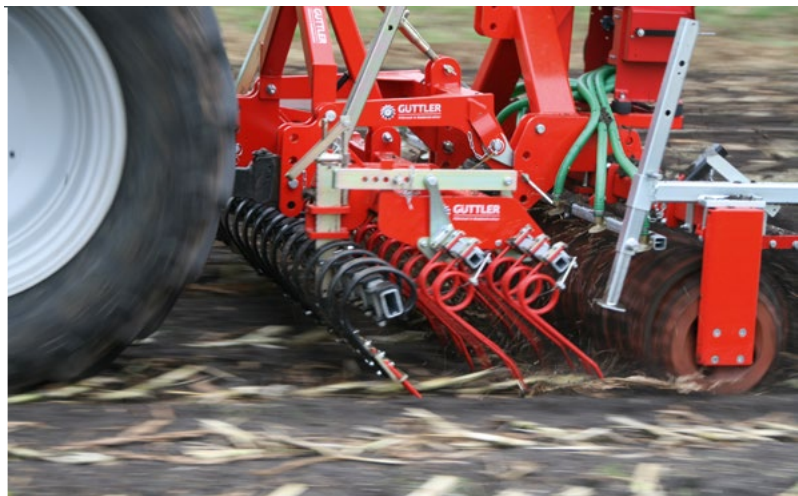
Maiszünsler bekämpfen, Winterbegrünung etablieren