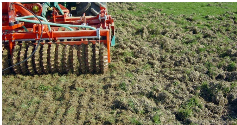
... und mit der Prismenwalze® sofort nachsäen!