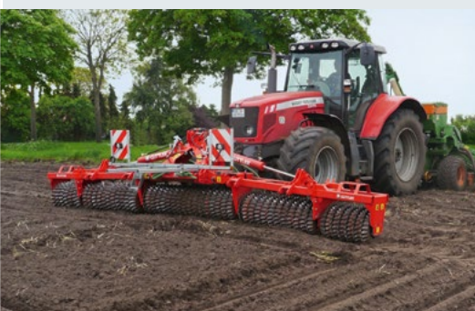
Zur Maissaat in Front

Vielfältiger Einsatz, ganzjährige Auslastung, schnelle Amortisation