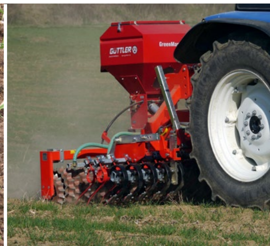
Untersaaten in Wintergetreide etablieren, Bestockungsanregung