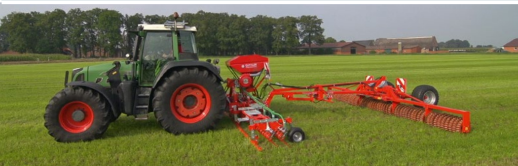
Green Seeder 600 mit angehängter Mayor 640