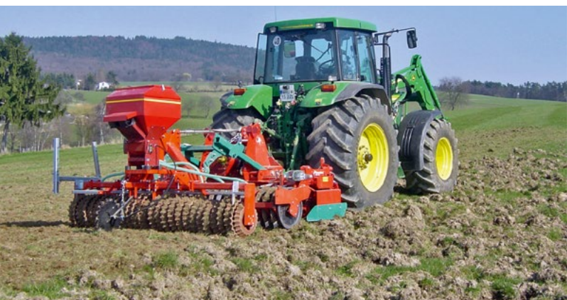
Schwarzwild-Schäden mit der Kreiselege eibebnen...

Rapsstoppel flach anritzen - Rapsstroh anschlagen und Strohhrotte beschleunigen