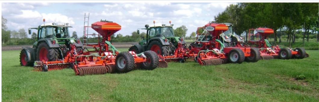
Drei der mittlerweile sechs GreenMaster der Hansa GmbH.