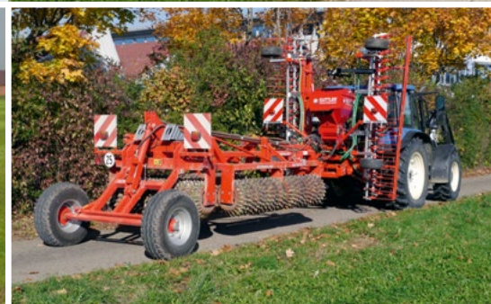
Transportbreite 2,5 m