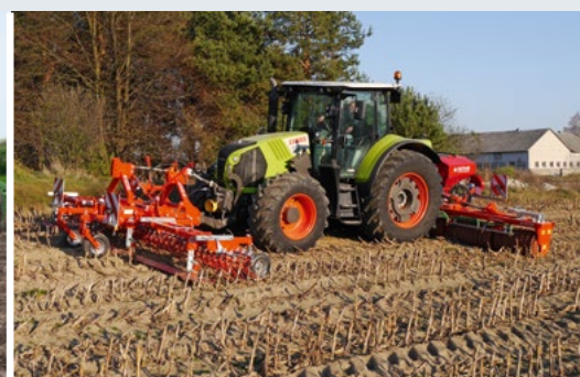
Maiszünsler bekämpfen und Begrünung ansäen mit hoher Schlagkraft