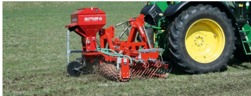
Stallmist verteilen mit dem Green Master 300