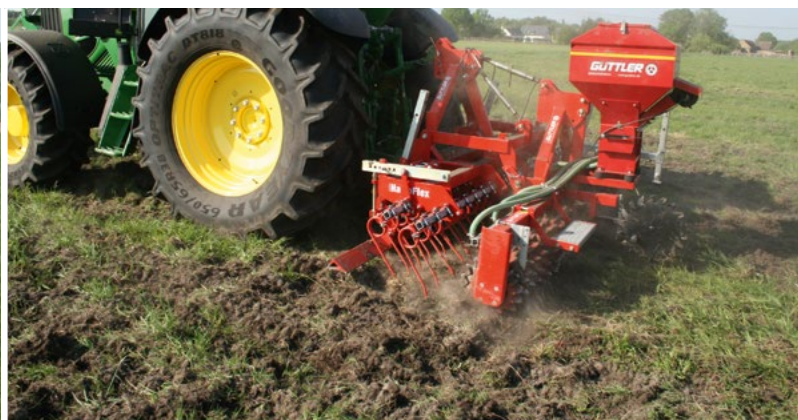
Schwarzwildschäden beheben: Mehrmals über Kreuz flach striegeln und nachsäen.