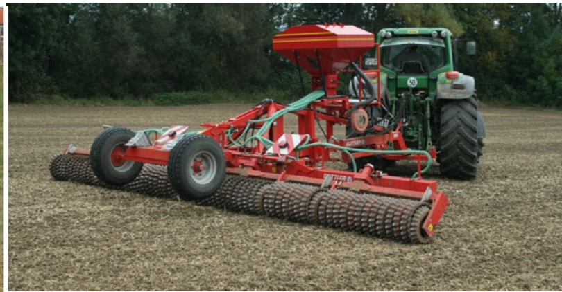
Walzen vor oder nach der Saat