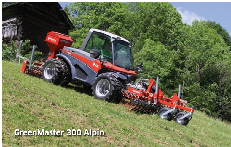
GreenMaster 300 Alpin

Bei einer Saatstärke von 5 kg/ha Weidelgras und einem Tausendkorngewicht von 2,5 Gramm haben Sie immerhin 200 Samen pro Quadratmeter.