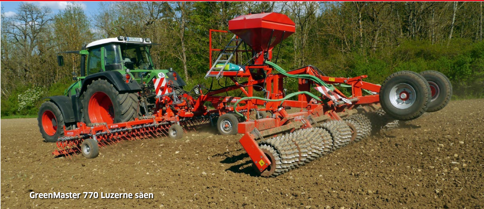
GreenMaster 770 Luzerne säen