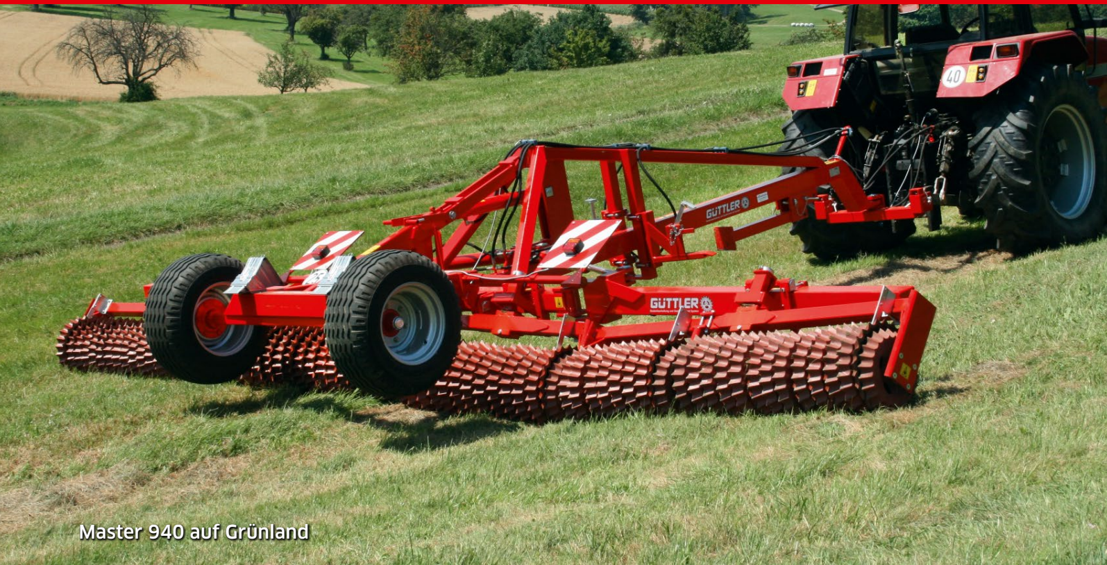
Master 940 auf Grünland