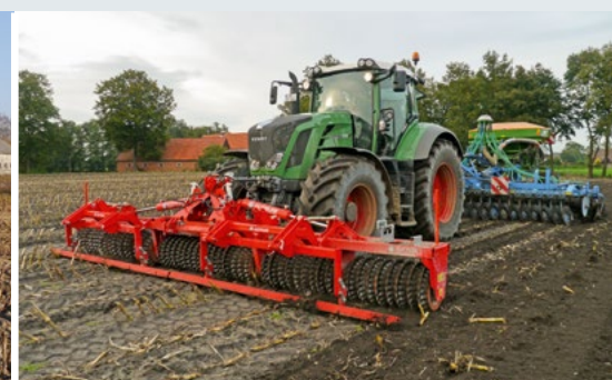
Maiszünslerbekämpfung in der Front, Stoppelbearbeitung und Begrünung ansäen im Heck