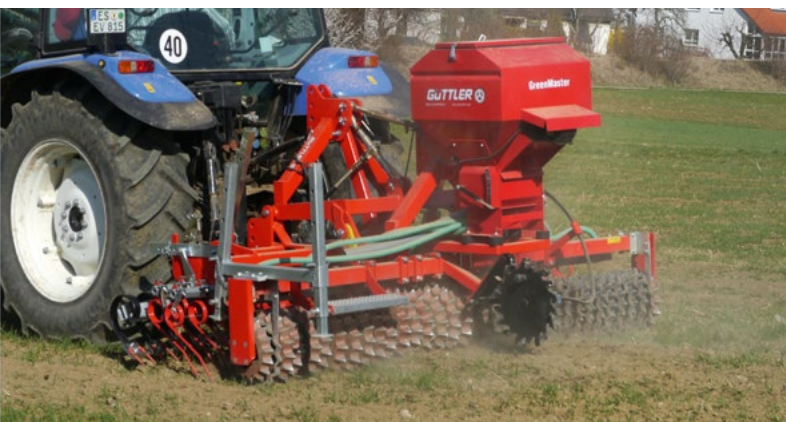
Wintersaaten zur Bestockung anregen, Untersaaten in Getreide etablieren.