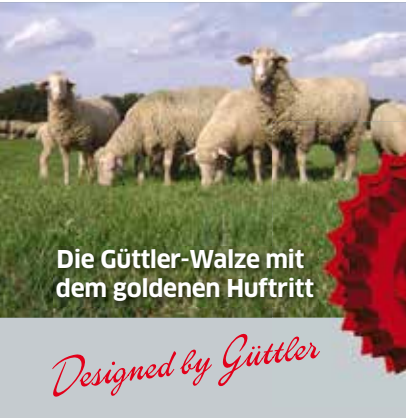
Die Güttler-Walze mit dem goldenen Huftritt