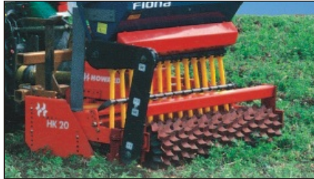
... auch an Kreiseleggen oder Fräsen.