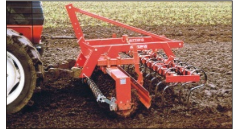
... auch mit Zinkvorsatz.