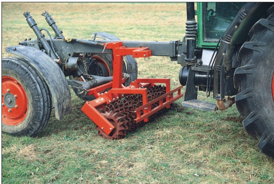
Mehrfach-Dreipunkturm für Front-, Heck- und Zwischenachsnaubau