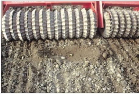
Optimale Rückfestigung - ideale Struktur