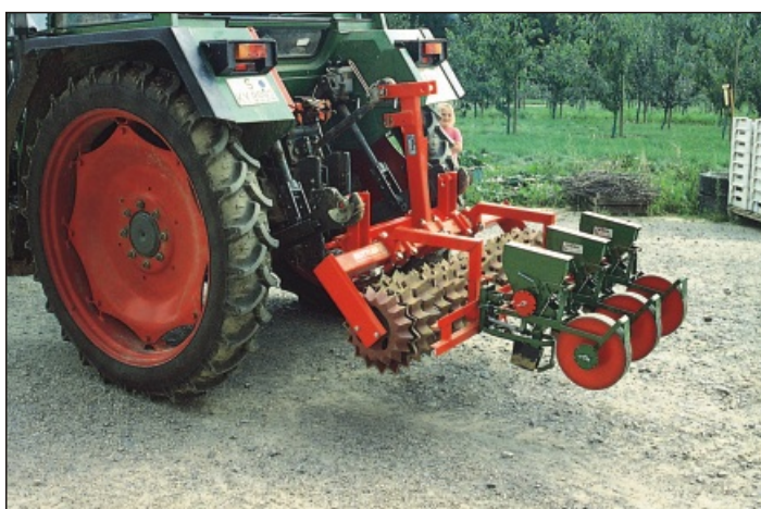
Geräteschiene für Sembdner-Sägeräte

während Grobkümel nach oben gebracht werden = bester Verschlämmungsschutz